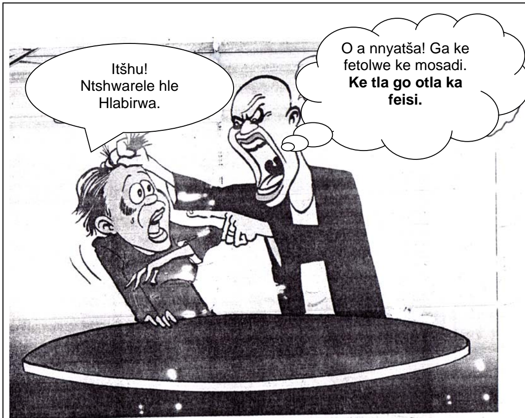
[Sowetan, Friday, 29 June 2007]

5.1 Tsinkela khathuni ye e latelago gore o tle o kgone go araba dipotšišo.