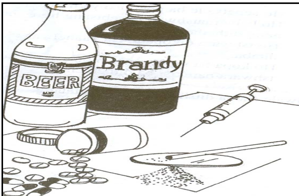
[Xifaniso lexi xi huma eka nkandziyiso wa va ka Nova Development Corporation]