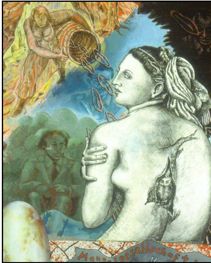
Jorg Immendorf, Samelewing van tekortkominge , 1998. Olie op doek.

Herinnering, snw. Vermoë waardeur dinge herroep word of in die bewussyn gestoor word; beeld of idee voorgestel deur die bewussyn; voortbestaan van so 'n idee. (Vry vertaal: Oxford Dictionary )