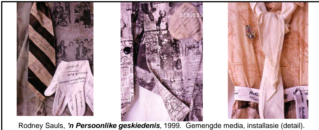
Rodney Sauls, 'n Persoonlike geskiedenis , 1999. Gemengde media, installasie (detail).

Persoonlike en familieherinneringe word in foto-albums, joernale, briewe en deur mondelinge geskiedenis bewaar. Aandenkings word as 'n teken van nagedagtenis aan plekke en reise versamel. Die herinneringe van die verre verlede word deur argeologie geopenbaar en in museums bewaar. Volke het nog altyd hul herinneringe deur die oprigting van monumente en gedenktekens bewaar.