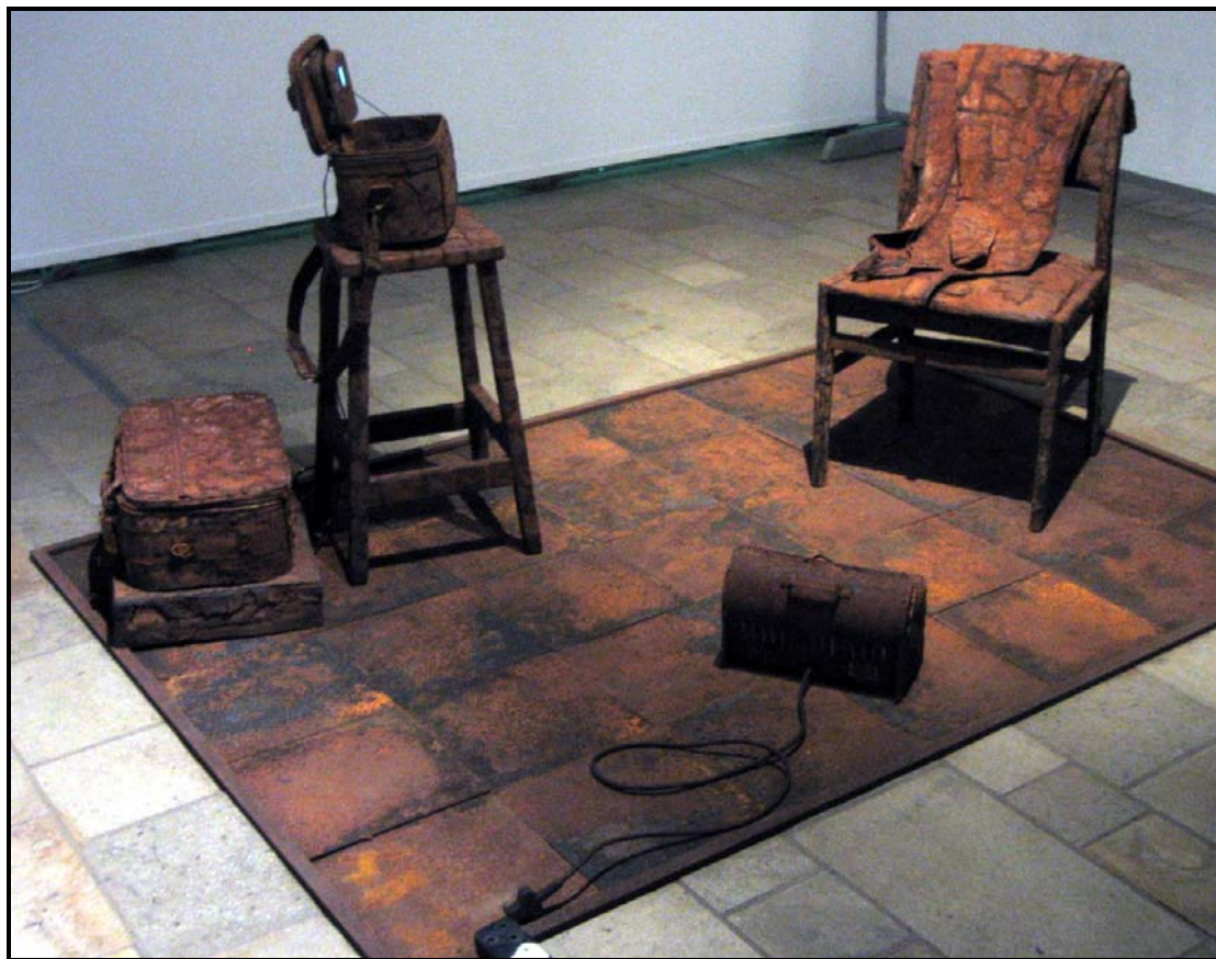
Jan van der Merwe, Dit is koud daar buite , 2004. Installasie.

Op 'n gedeelte van 'n geteelde vloer is 'n stoel geplaas met 'n vrou se onderrok oor die rugleuning en sitplek gedrapeer, 'n klein elektriese verwarmers, en 'n staander met 'n oop grimeertassie. In die deksel van die tassie is 'n klein televisie monitor waar 'n naby beeld gesien word van hoe lipstiffie aan lippe gesit word. 'n Tas lê op die vloer.