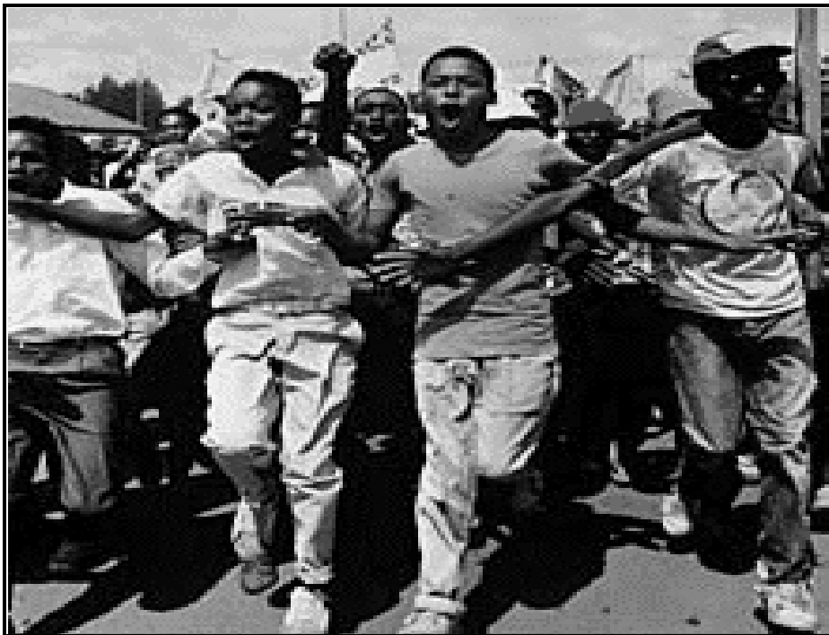
[Motswedi: Inthanete ]