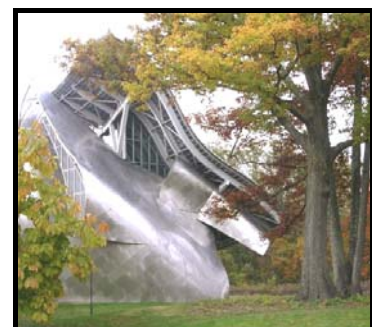
Fisher Uitvoerende Kunste Sentrum