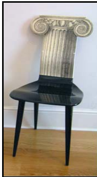
'Fornasetti' of 'Ioniese Pilaarkop' Stoel deur Piero Fornasetti

Terwyl Modernisme historiese invloede verwerp het, het die rebelse 1960s (Pop-era) die verlede vir inspirasie uitgebuit. ☑ Die resultaat is 'n lappiesak van style van oraloer. Fornasetti het vanuit die Griekse / Romeinse Klassieke kultuur aangehaal/ geleen ☑ en het die Ioniese pilaar – die pilaarkop – 'n kinkel gegee om dit een van hulle kenmerkende/ 'tydlose' ontwerpe te maak. ☑ Die klassieke ideale, soos skoonheid, harmonie en intellek het ook byval gevind by die 'vrye liefde hippie' kultuur van die Pop-era. ☑ Tipies van die Popontwerp is die feit dat hierdie ontwerp meer op die jeug gebaseer en minder ernstig was vergeleke met die Goeie Ontwerp van die 1950s. ☑ Die ironiese humor sigbaar in die sterk gewigdraende pilaarkopvorms wat omskep is in fantasie meubelstukke – waarin Surrealisme 'n rol gespeel het – is ook 'n tipiese kenmerk van baie Popontwerpe. ☑ Swart en wit word 'n gewilde kleurskema, beïnvloed deur Opkuns en die werk van Bridget Riley en dit is ook sigbaar hier. ☑ Die stoel herinner ook aan die Viktoriaanse era en grafiese drukke in boeke. ☑ Hierdie stoel is soortgelyk aan die 'Capitello' Stoel van Studio 65. ☑