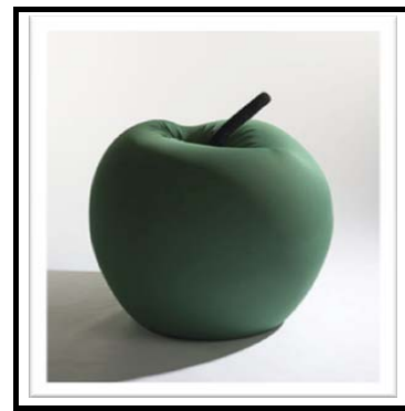
'Green Apple' Stoele

'n Verskeidenheid meubels deur Studio 65