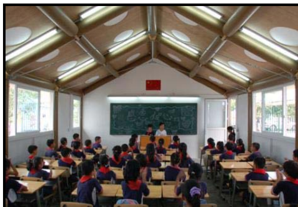
Links: 'n vesting opgerig van papier en karton. Regs: 'n skool in Sjina van papierpype.

Ban het vanaf 1995 vestings met waardigheid en grasia geskep toe hy te voorskyn gekom het om die roep vir tydelike huisvesting te beantwoord, vir die oorlewendes van die aardbewing wat Kobe, Japan platgevee het. Sy vreemde ontwerpe het gekom van nederige materiale soos bierkrat-fondasies en papierpype vir mure. Die werk van Ban is duidelik 'n bewys van die verskaffing van positiewe ondersteuning, herstel en hervorming van mense se lewens na rampspoedige gebeure.