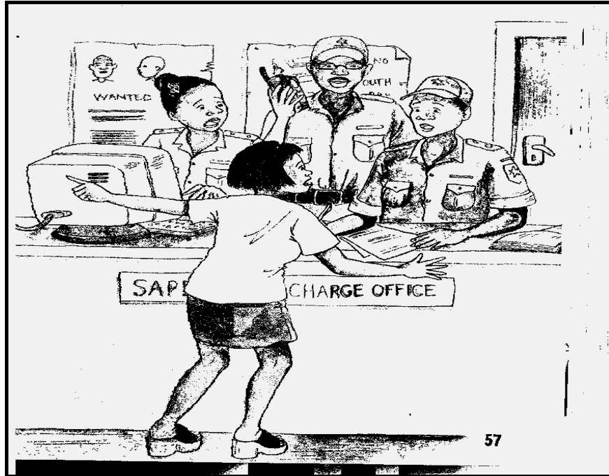
[Setshwantsho se qotsitswe bukeng ya A re Sogeng thari , MM Moemi le ba bang]