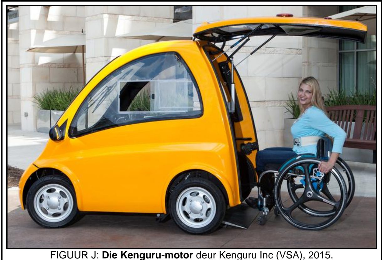
FIGUUR J: Die Kenguru-motor deur Kenguru Inc (VSA), 2015.