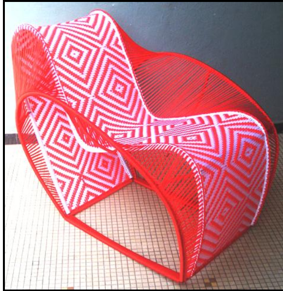
FIGUUR K: Stoel deur Cheick Diallo (Mali), 2014.

5.2.1 Bespreek die sosiale en ekonomiese toepaslikheid van die gebruik van tradisionele handwerk tegnieke en -materiaal by kontemporêre produkte deur na die stoel in FIGUUR K te verwys. (4)