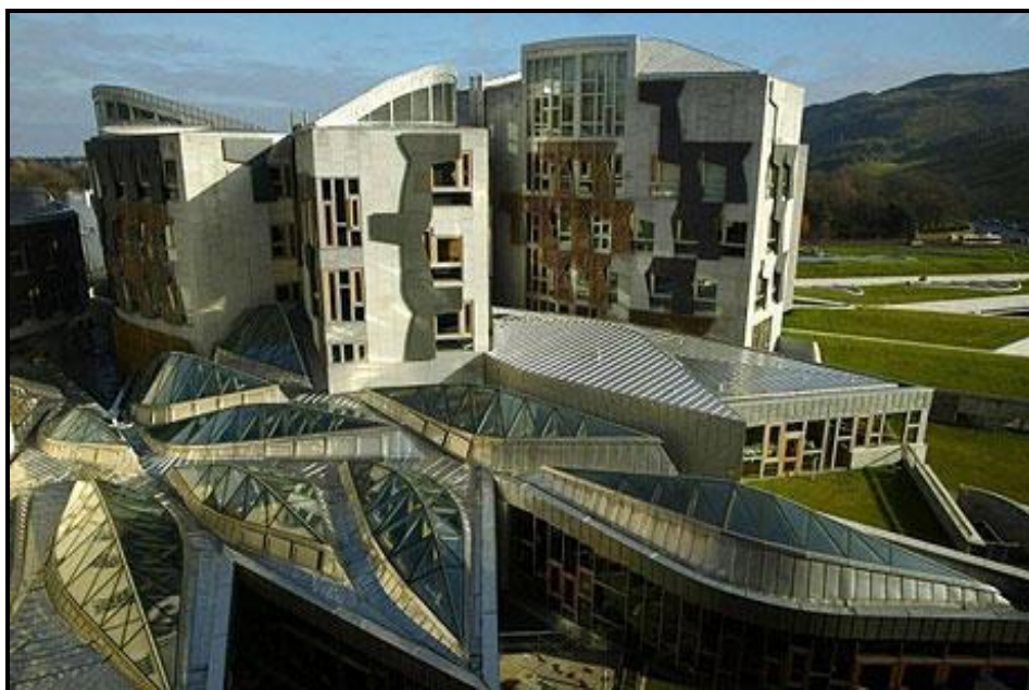
FIGUUR G: Die Skotse Parlement deur Enric Miralles (Edinburgh), 1999–2004.

Skryf 'n opstel van ten minste 200–250 woorde (een bladsy) waarin jy die gebou in FIGUUR F met die gebou in FIGUUR G vergelyk. Of anders kan jy enige Klassieke gebou (wat jy bestudeer het) met enige kontemporêre gebou vergelyk.