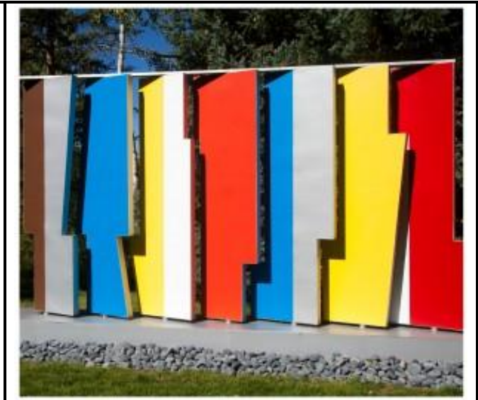
FIGUUR I: Herbert Bayer-Kaleidoskerm deur Aluminium Company, Bauhaus (Amerika), 1957.

Skryf 'n opstel van ten minste 200–250 woorde (een bladsy) waarin jy die kenmerke van die Kuns-en-Kunsvlytbeweging met die kenmerke van die Bauhaus-skool vergelyk, soos in die twee werke hierbo weergegee.