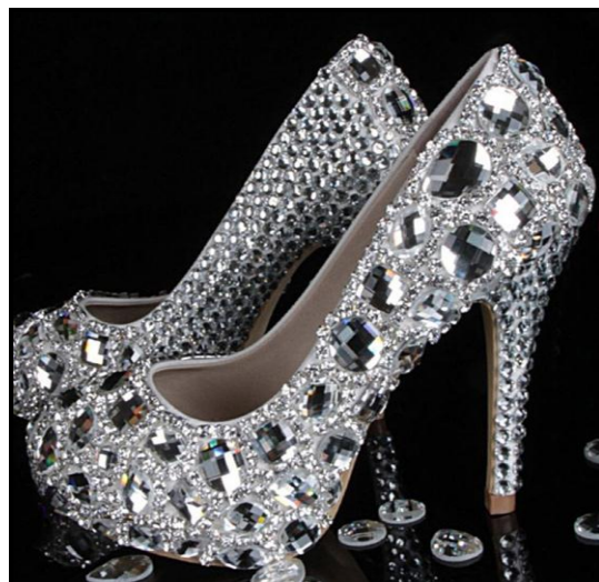
FIGUUR E: Spykerhakskoene met juwele versier ('Jewelled stilettos') deur AliExpress (VSA), 2014.

In 'n opstel van 200–250 woorde (een bladsy) vergelyk FIGUUR D met FIGUUR E hierbo deur hulle ooreenkomste en verskille ten opsigte van die volgende te bespreek: