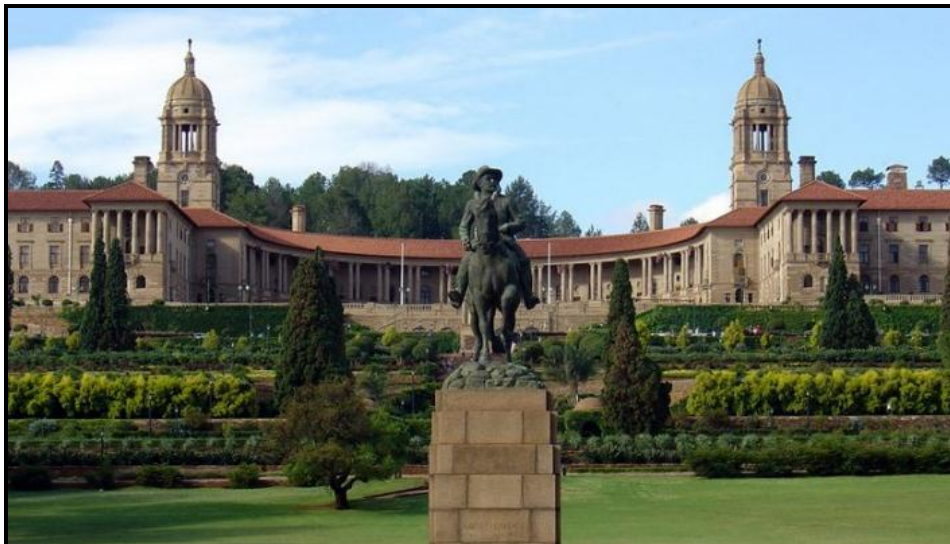
FIGUUR F: Die Uniegebou deur Herbert Baker (Pretoria), 1909–1910. Die Uniegebou is die amptelike setel van die Suid-Afrikaanse regering.