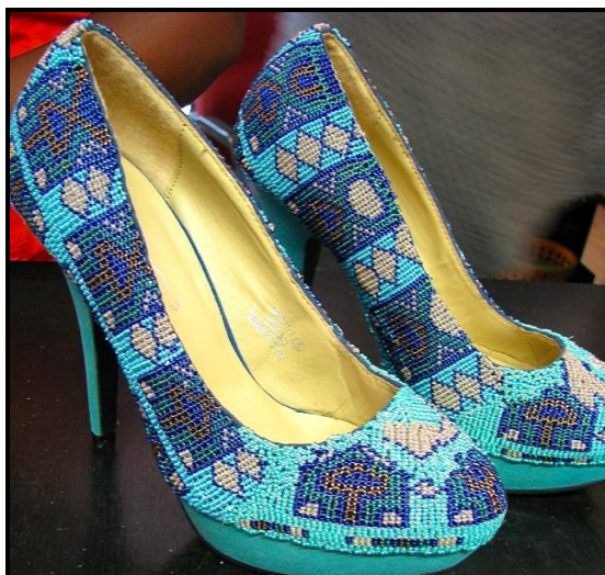
FIGUUR D: Spykerhakskoene met kralewerk ('Beaded stilettos') deur Lindiwe Ngcobo (KZN, Suid-Afrika), 2011.