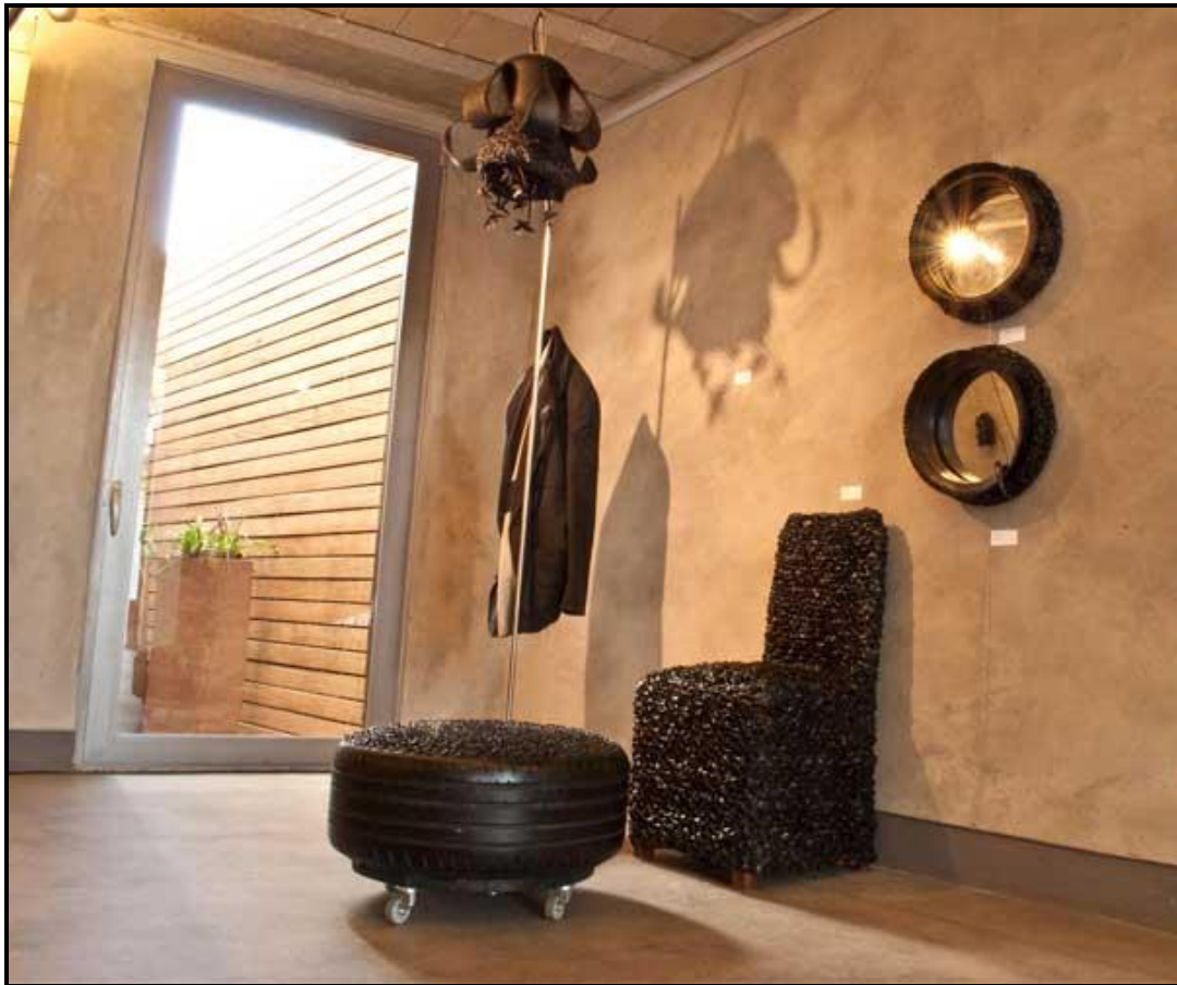
FIGUUR L: Rubber, Recycle, Relove (Rubber, Herwin, Herbemin) deur Roché Van Den Berg (Suid-Afrika), 2011.

6.1.1 Definieer die term koolstofspoor . (2)