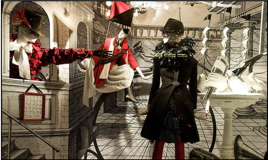
FIGUUR B: Bergdorf Goodman-vensteruitstalling deur Louis Vuitton (New York), 2008.

Analiseer die gebruik van die volgende element en beginsels in FIGUUR B. Verduidelik hoe hierdie element en beginsels gebruik word om 'n eenheidskomposisie te skep: