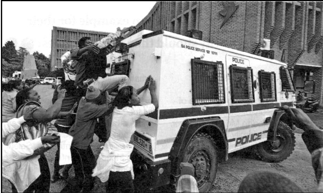
[Mothopo:Move, March 2014]