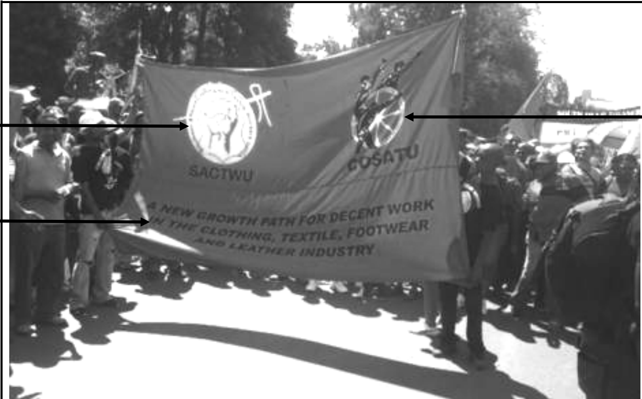
[Uit http://ewn.co.za/2015/10/07/Cosatu-marches-underway-in-CT-and-JHB . Toegang op 20 Januarie 2018 verkry.]

Die foto hieronder, deur K Mogale, het op die webblog van Eye Witness News verskyn. Dit toon lede van die Congress of South African Trade Unions (COSATU) en die South African Clothing and Textile Workers Union (SACTWU) wat op 7 Oktober 2017 in Kaapstad marsjeer.