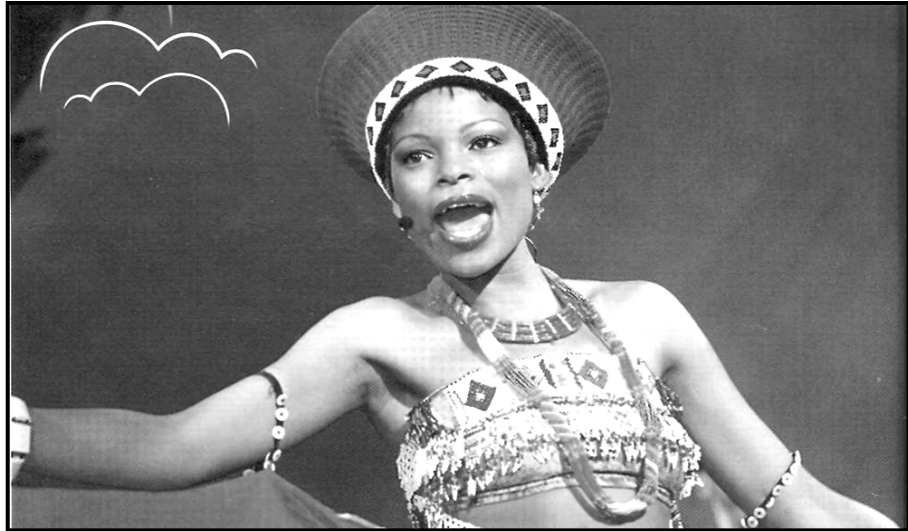
[Xi huma eka: Art explosion 300,000 (Premium Image Collection)]