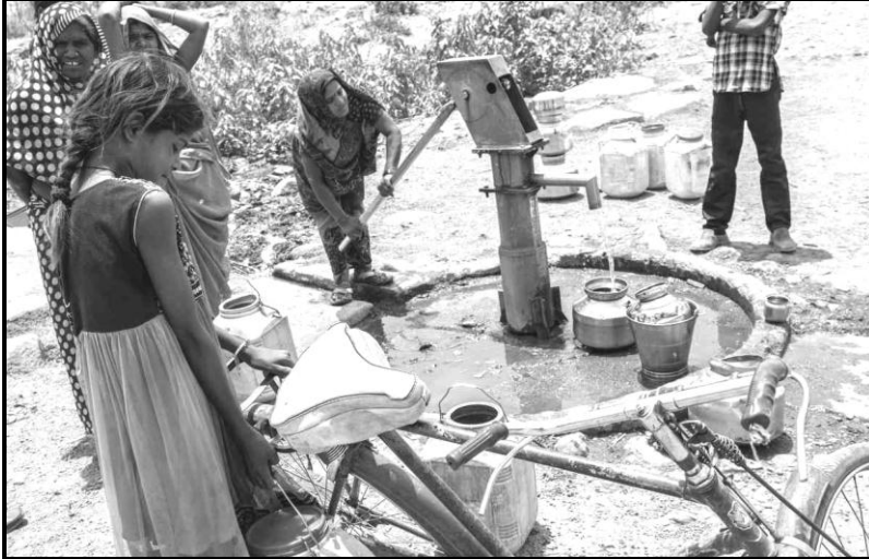
[Tshi bva kha inthanethe]