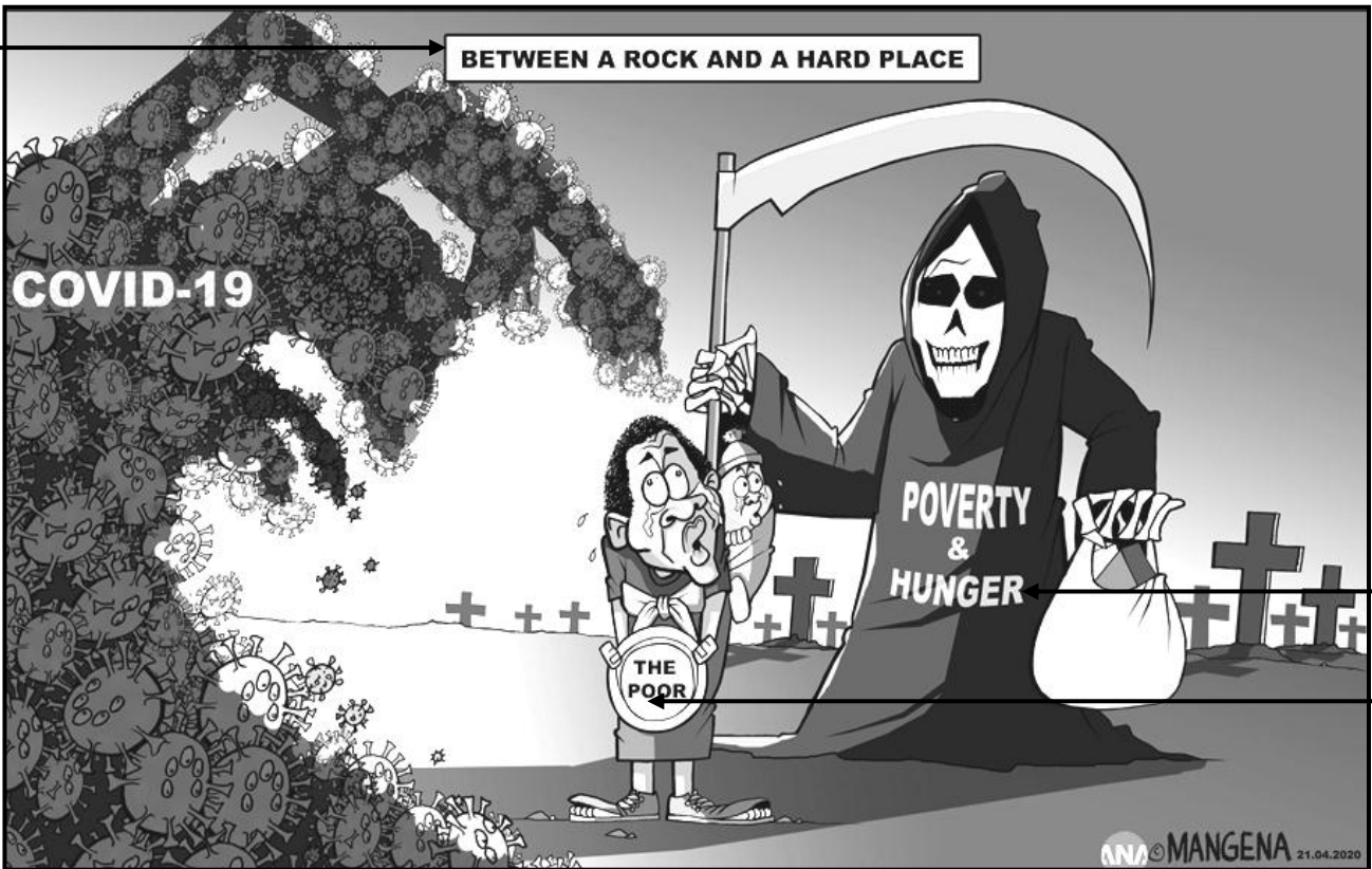
[Uit https://jcom.sissa.it/sites/default/files/documents/JCOM_1907_2020_A08.pdf . Toegang op 30 Mei verkry.]

Die spotprent hieronder, deur H Mangena, het op 21 April 2020 in 'n aanlyn publikasie van die African News Agency verskyn. Die spotprent beklemtoon die uitdagings van die armes as gevolg van die Covid-19-pandemie.