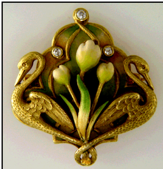
FIGUUR F: Swaan-borsspeld , Art Nouveau, circa 1890–1905.