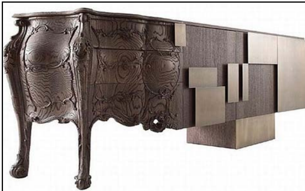
FIGUUR B: Evolution (Evolusie) , eikehoutbuffet deur Ferruccio Laviani (Verenigde Koninkryk), 2009.

6.2.1 Bespreek die titel van FIGUUR B en verduidelik hoe dit met hierdie ontwerp verband hou. (4)