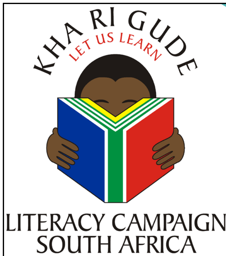
FIGUUR B: Geletterdheidsveldtog-plakkaat deur Kha Ri Gude (Suid-Afrika), 2011.

5.2.1 Dink jy dat die veldtogplakkaat hierbo inklusief vir almal is? Gee redes vir jou antwoord. (2)