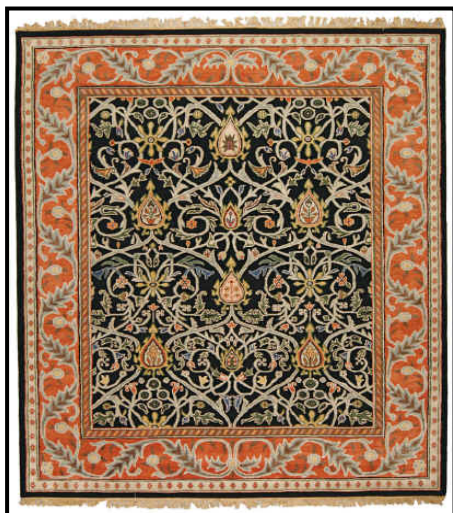
FIGUUR A: Black Tree (Swart Boom) , KUNS EN KUNSVLYT-mat deur William Morris, circa 1882.