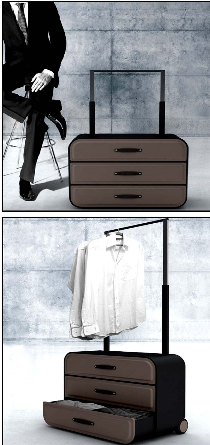
FIGUUR D: Traveller's Closet (Reisigerskas) , ontwerp deur Psychic Factory (Korea), 2010.

Pas 'n gedetailleerde 'SWOT'-analise op FIGUUR D hieronder toe.