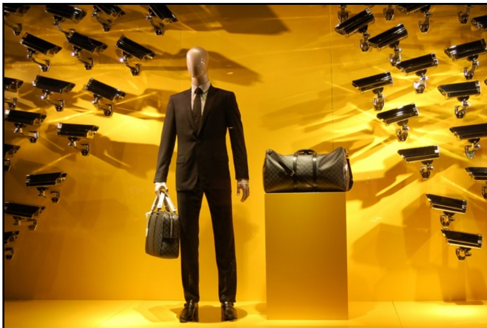
FIGUUR B: Vensteruitstalling, You're Under Surveillance (Jy word Dopgehou) , geskep deur Louis Vuitton (Frankryk), 2011.