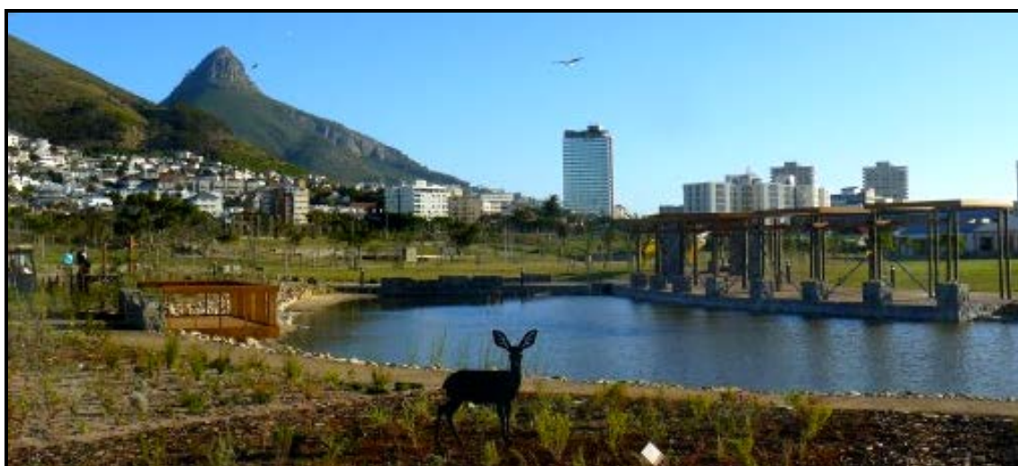
FIGUUR B: Speel-/Oefenpark en dierebeelde in Groenpunt Openbare Park , Kaapstad.