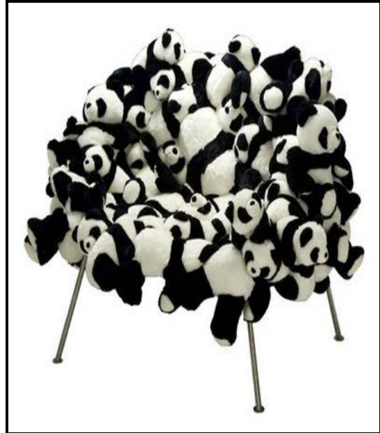
FIGUUR A: Panda-stoele gemaak van opgestopte, weggegooide speelgoed-diertjies deur Fernando en Humberto Campana (Brasilië), sedert 1984.

6.1.1 Hoe help FIGUUR A om die omgewing veilig en gesond te maak? (2)