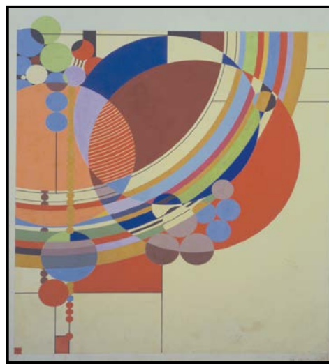
FIGUUR D: MODERNISTIESE mat deur Frank Lloyd Wright, circa 1955.