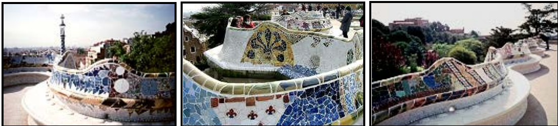
FIGUUR D: Openbare plein, Park Guell , met panoramiese uitsigte oor die stad Barcelona.

3.1.1 Is die openbare ruimtes in FIGUUR A tot FIGUUR D hierbo geskik vir alle mense? Motiveer jou antwoord. (4)