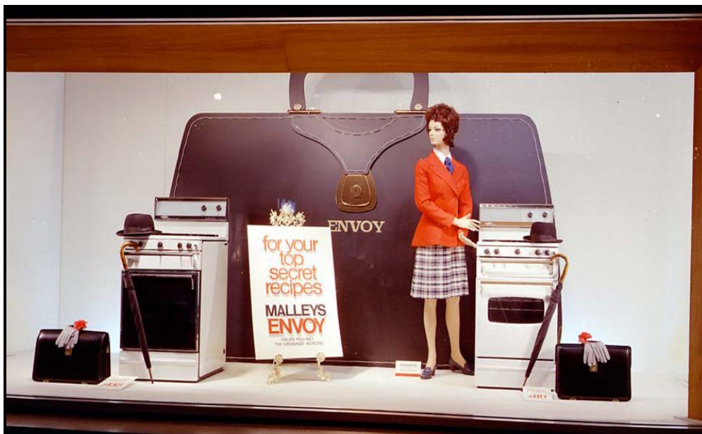
FIGUUR C: Malley's-stowe-vensteruitstalling , Gas & Fuel Corporation (Melbourne), 1972.