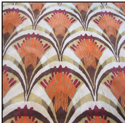
FIGUUR B: ART DECO-mat vir die San Francisco Fox Teater, 1930's.