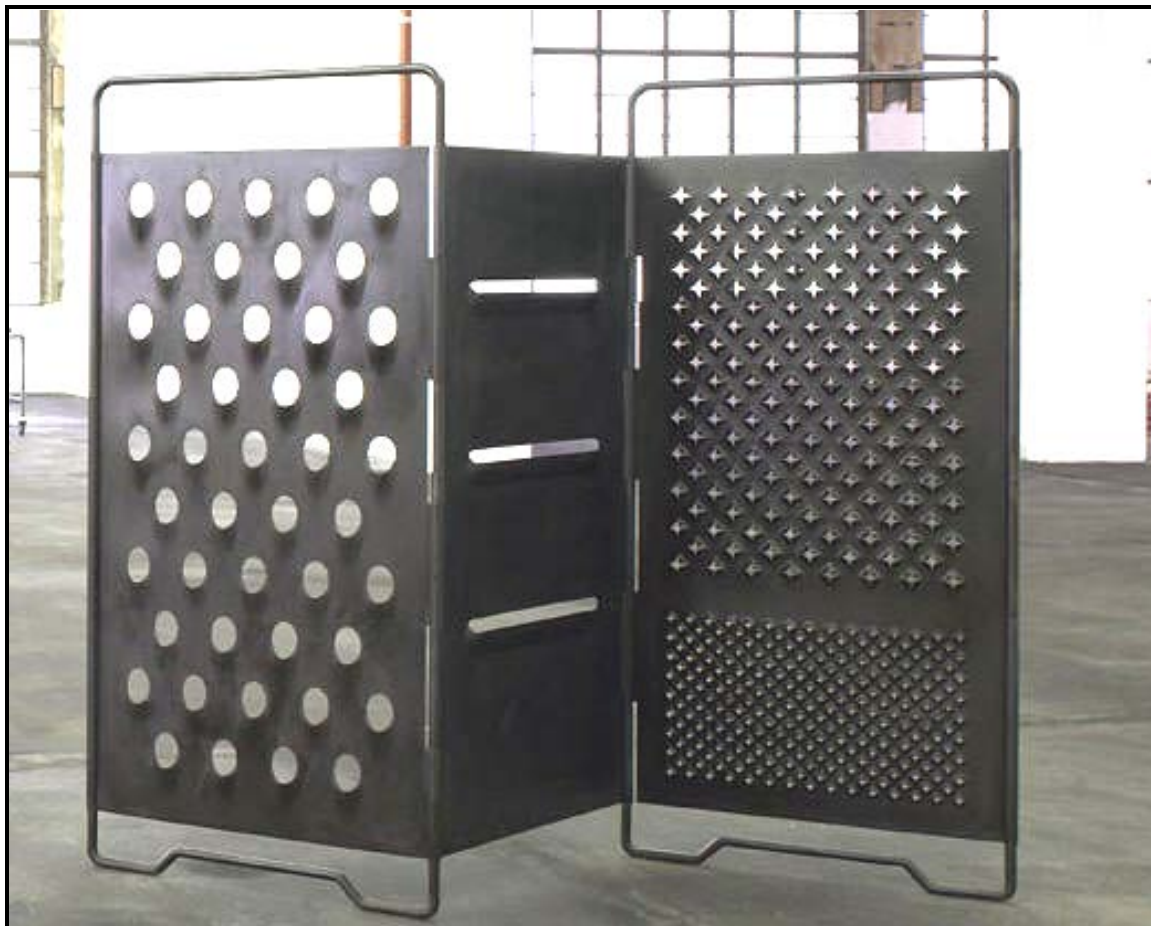
FIGUUR B: Paravent , 'n opvousterk wat gebruik word om 'n vertrek in twee aparte ruimtes te verdeel. Die skerm/verdelers is geïnspireer deur 'n reusekaasrasper wat die ontwerper, Mona Hatoum, aan haar huis herinner het (Londen), 2008.

1.2.1 Die voorbeeld hierbo word as 'n elitistiese (voorkeur aan 'n bevoorregte groep) ontwerp gesien. Stem jy saam? Gee redes vir jou antwoord. (6)