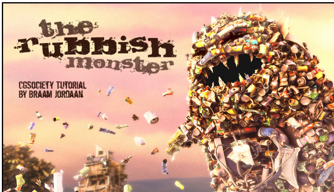
FIGUUR C: The Rubbish Monster (Die Rommelmonster) deur Braam Jordaan (Suid-Afrika), 2010.

6.3.1 Hoe inspireer FIGUUR C hierbo omgewingsbewustheid? (2)