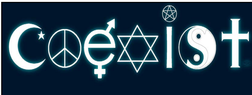
FIGUUR A: Coexist (Saambestaan) , bufferplakker (ontwerper onbekend).