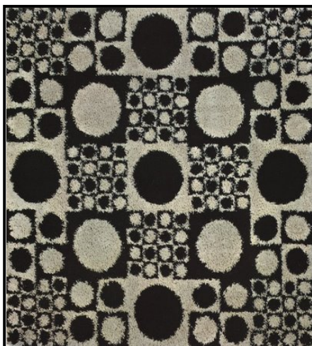
FIGUUR E: POP-era-mat deur Verner Panton, 1960's.