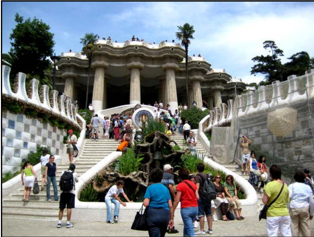
FIGUUR C: Hoofingang na Park Guell , ontwerp deur Antonio Gaudi (Spanje), 1923.