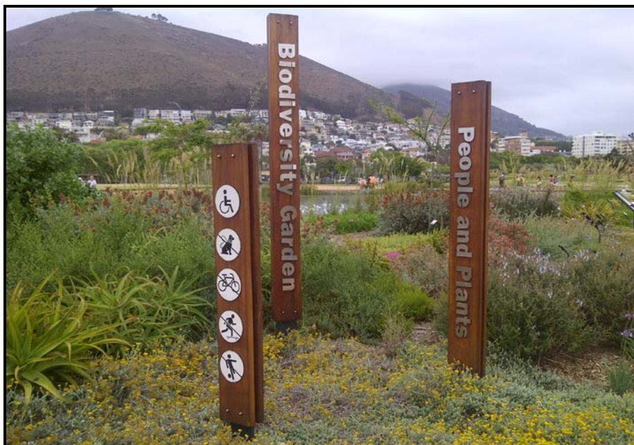
FIGUUR A: Groenpunt Openbare Park , ontwerp deur Johan van Papendorp en OvP Vennote (Kaapstad, Suid-Afrika), 2011.

3.1 Verwys na FIGUUR A, B, C en D hieronder en beantwoord die vrae wat volg.