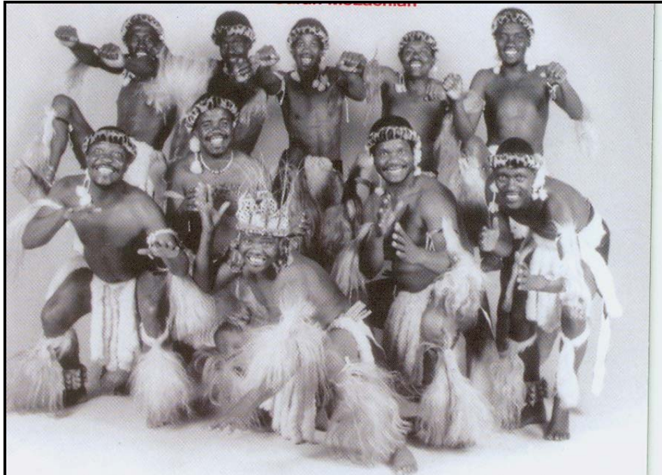
[Khabara ya CD ya Ladysmith Black Mambazo: Long walk to freedom ]