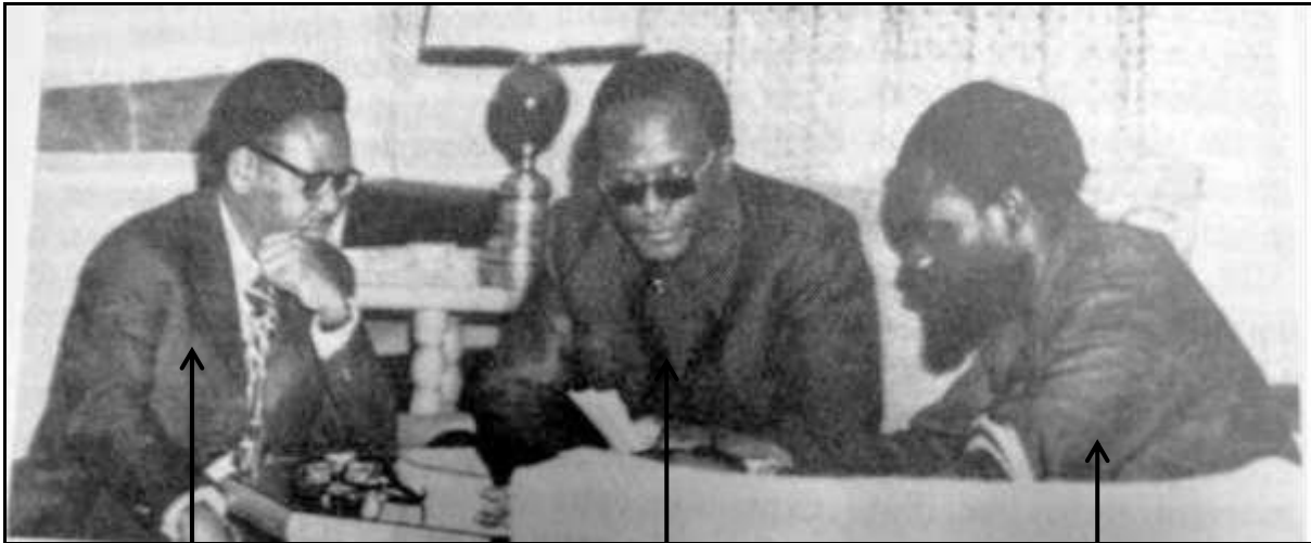
Agostinho Neto (MPLA)

Die foto hieronder toon Agostinho Neto (MPLA), Holden Roberto (FNLA) en Jonas Savimbi (UNITA) in gesprek by die Alvor-spitsberaad wat in Portugal gehou is. Dit is op 15 Januarie 1975 in die News Diary of Lisbon , 'n Portugese koerant, gepubliseer.