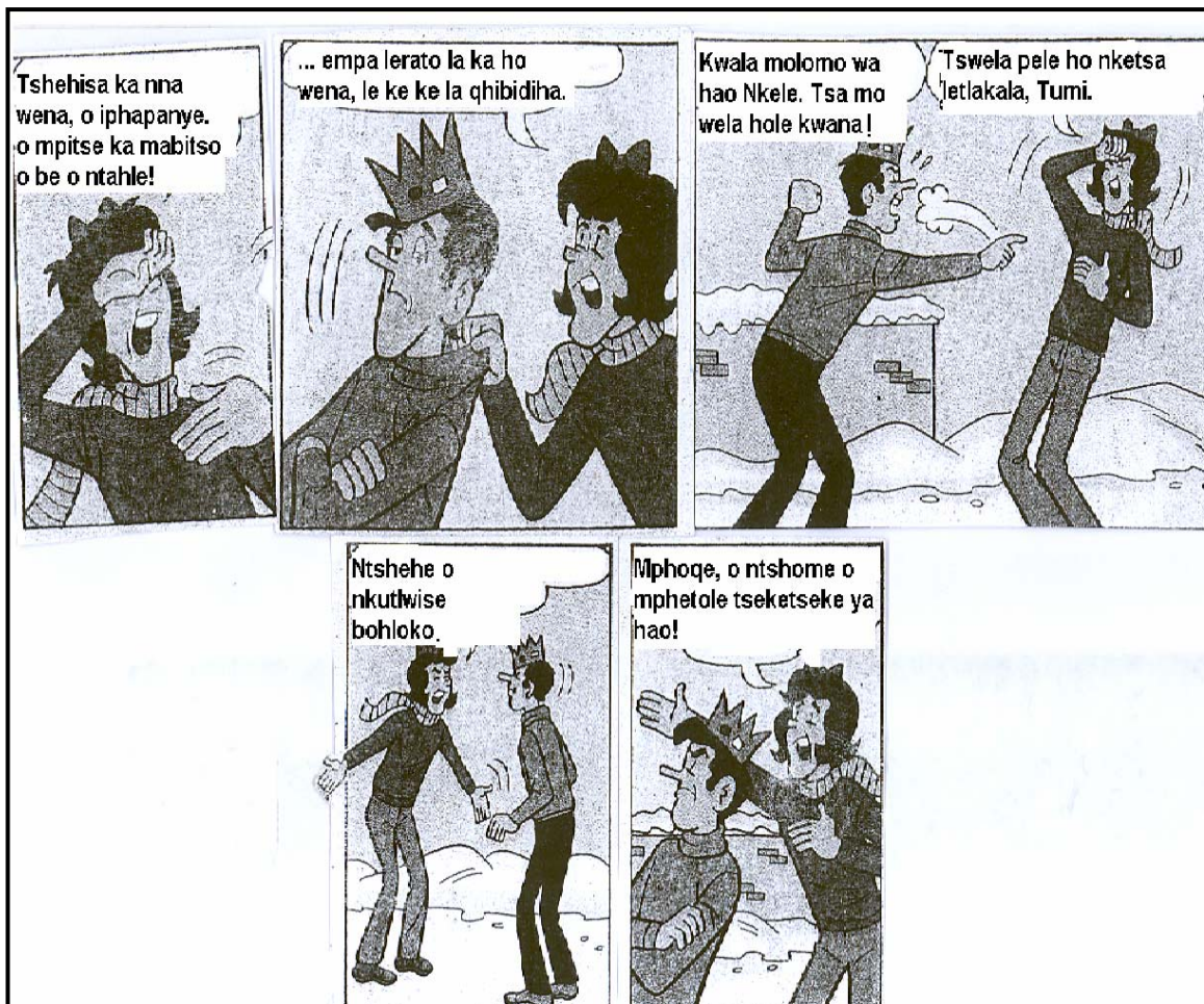
E qotsitse le ho lokiswa ho tswa ho B & V Friends Double Digest , 2010]