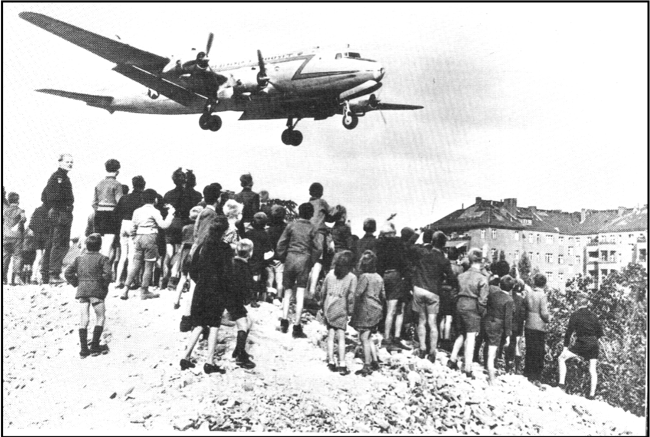
[Uit: The Oxford Illustrated History of Modern Europe , redakteur TCW Blanning]

Hierdie foto, wat in 1948 geneem is, toon 'n Amerikaanse vragvliegtuig wat voorraad vervoer en besig is om op Tempelhof-lughawe in Wes-Berlyn te land. Die fotograaf is onbekend.