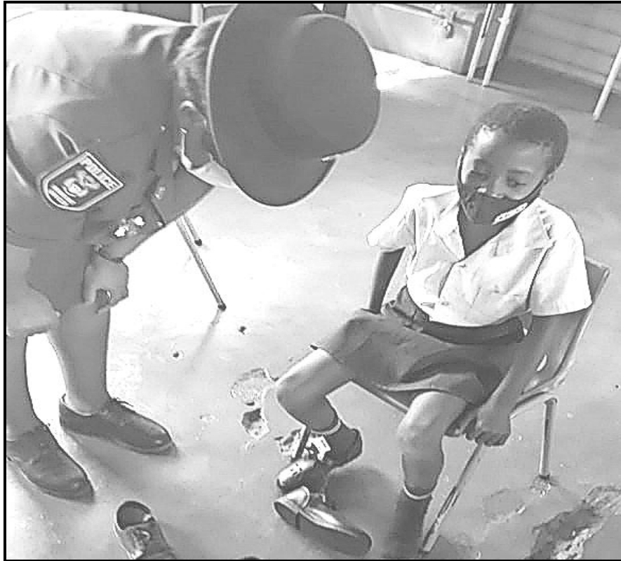
[E nopotswe go tswa mo inthaneteng]