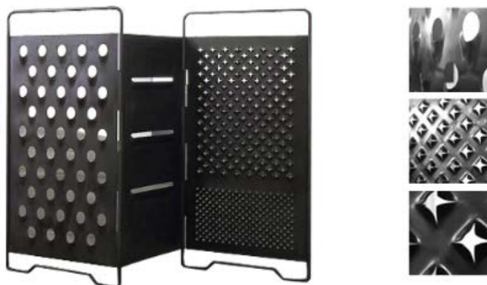
Paravent – 'n opvouskerm of verdeler geïnspireer deur 'n reusekaasrasper, ontwerp deur Mona Hatoum.