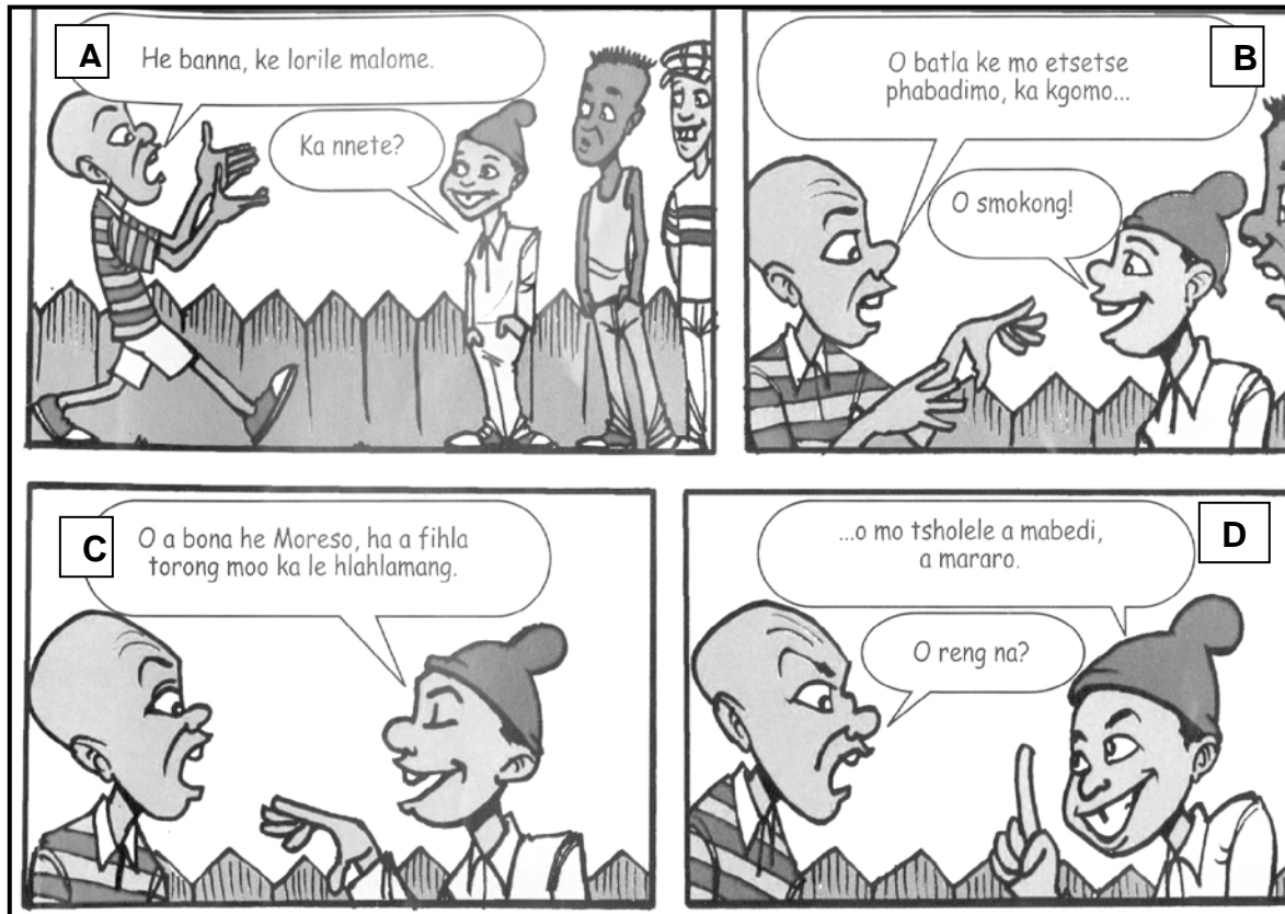
[E qotsitse le ho lokiswa ho tswa makasineng wa BONA , Mphalane 2008, leq 115]