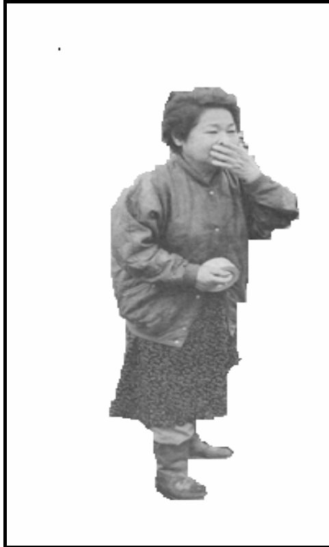
[Aangepas uit: Die Burger , Maart 2011]