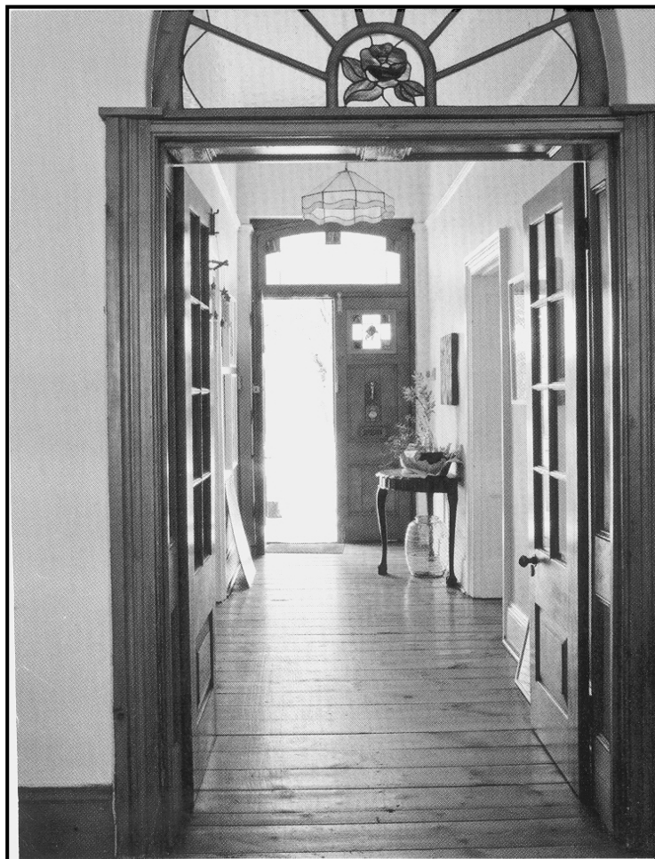
[Uit: Leef , Oktober 2010]