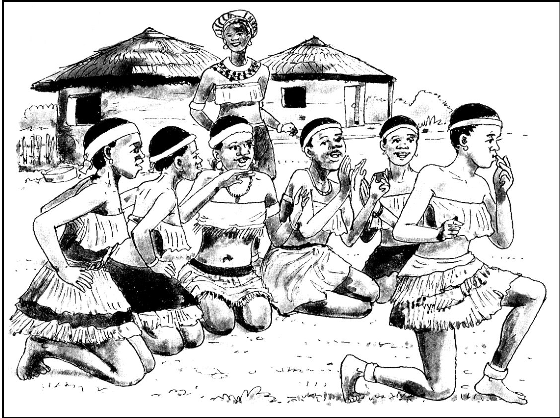
[Setshwantsho se qotsitse bukeng ya Sesotho sa Nnete ; Kereite 9, Phuroe le ba bang; 2006: 12]