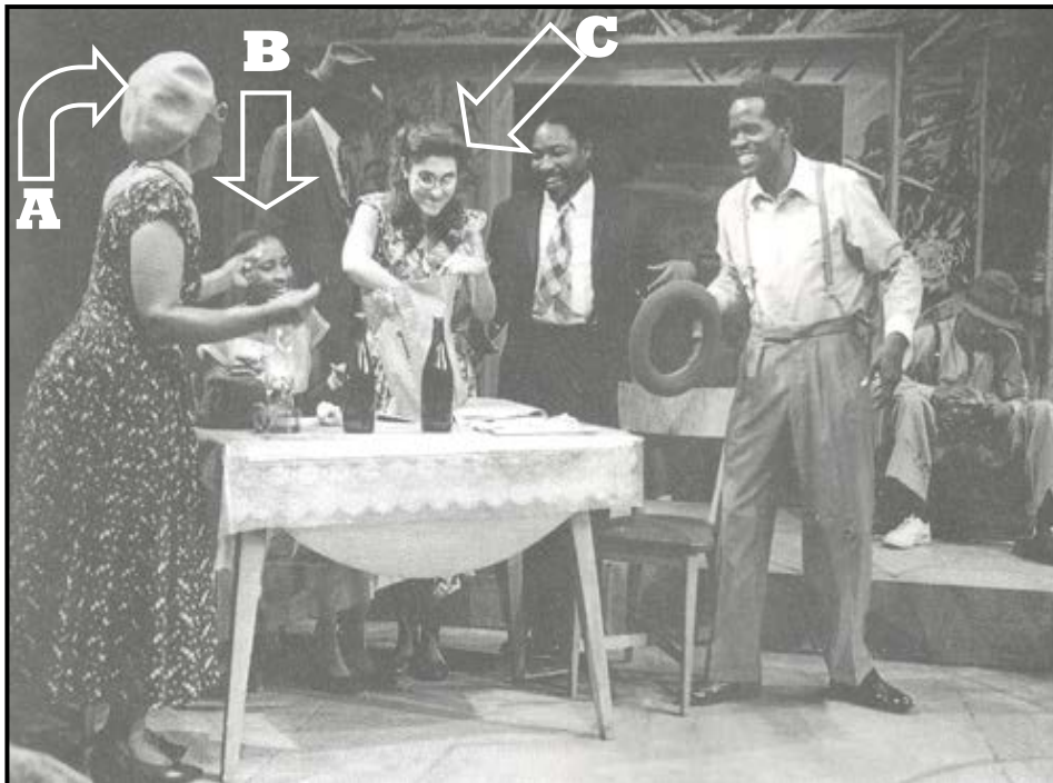
'n Produksiefoto van Sophiatown wat die uittreksel in BRON B weerspieël