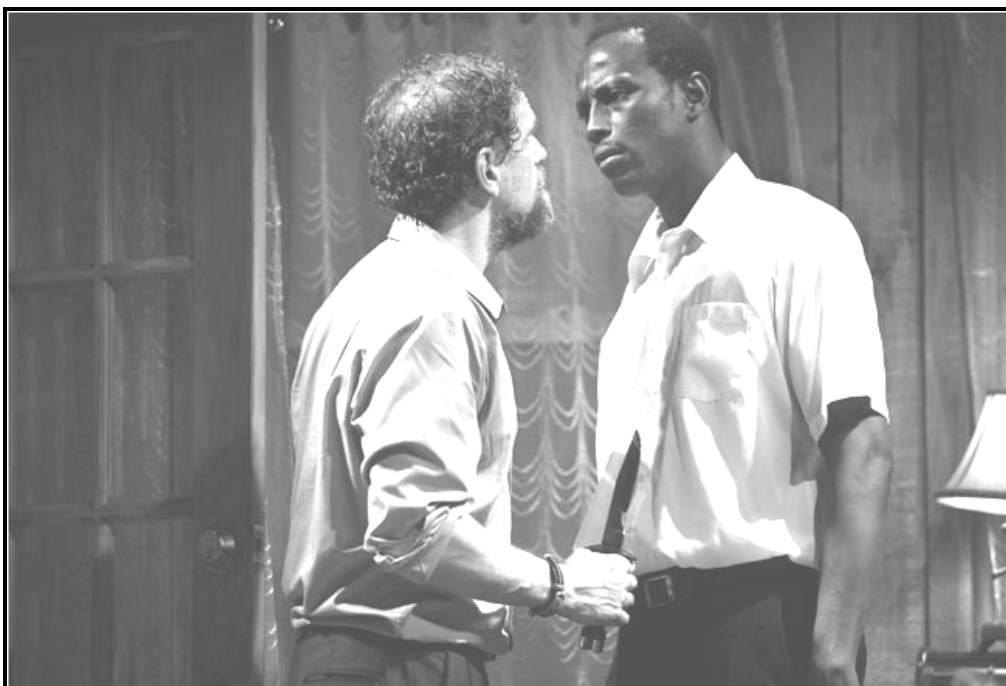
'n Produksiefoto van Groundswell wat die uittreksel in BRON A weerspieël