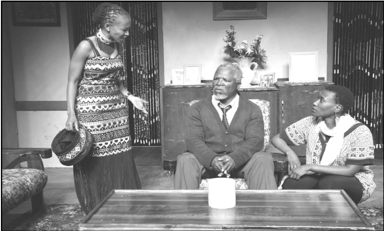
'n Produksiefoto van Nothing but the Truth wat die uittreksel in BRON B weerspieël