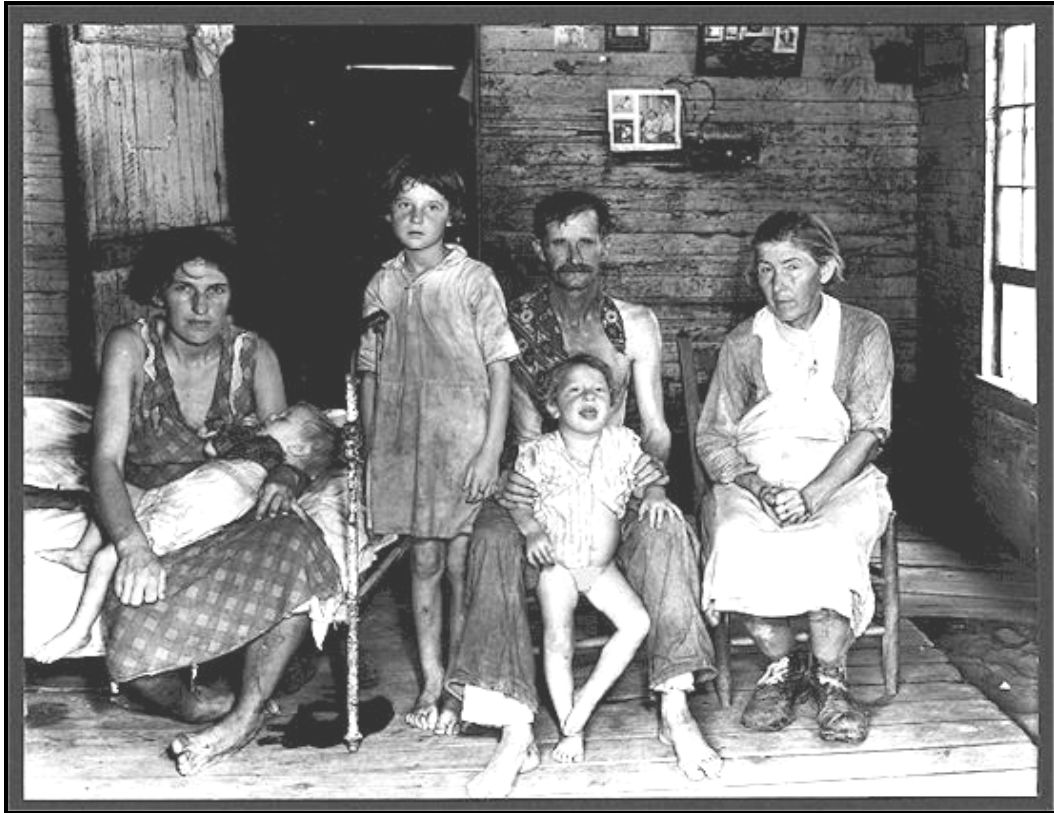
'n Foto wat tydens die Groot Depressie (1929–1933) geneem is