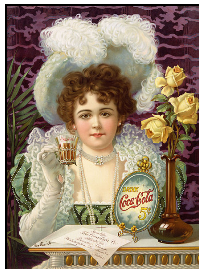
FIGUUR C: Coca-Cola-advertensie (VSA), 1890.

Bestudeer die visuele beelde hierbo en gee redes hoekom die ontwerpe in FIGUUR B en FIGUUR C nie relevant sal wees in 'n kontemporêre Suid-Afrikaanse gemeenskap nie.