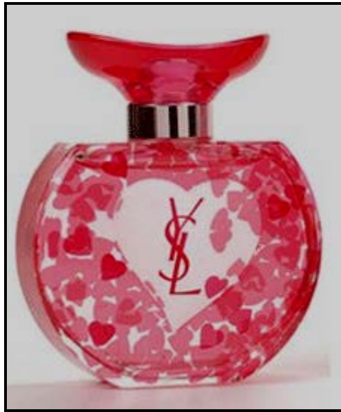
FIGUUR A: Young Sexy Lovely , fyngeur deur Yves Saint Laurent (VSA), 2011.