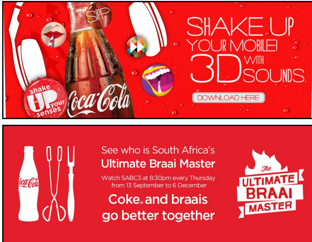
FIGUUR A: Coca-Cola-reklamebordadvertensies, David Butler (VSA), 2013.

7.2.1 Deur na bogenoemde stelling te verwys, verduidelik hoe beide advertensies vir Coca-Cola (FIGUUR A) aangepas is om in die behoeftes van 'n vinnig veranderende teikenmark te voorsien.