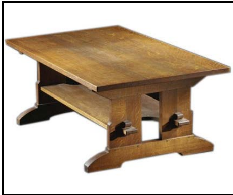
FIGUUR A: Boktafel , L&JG Stickley (VSA), circa 1910.

4.1 Elke tafel (FIGUUR A tot E) hieronder verteenwoordig 'n ander styl/beweging van die Westerse ontwerpgeskiedenis.