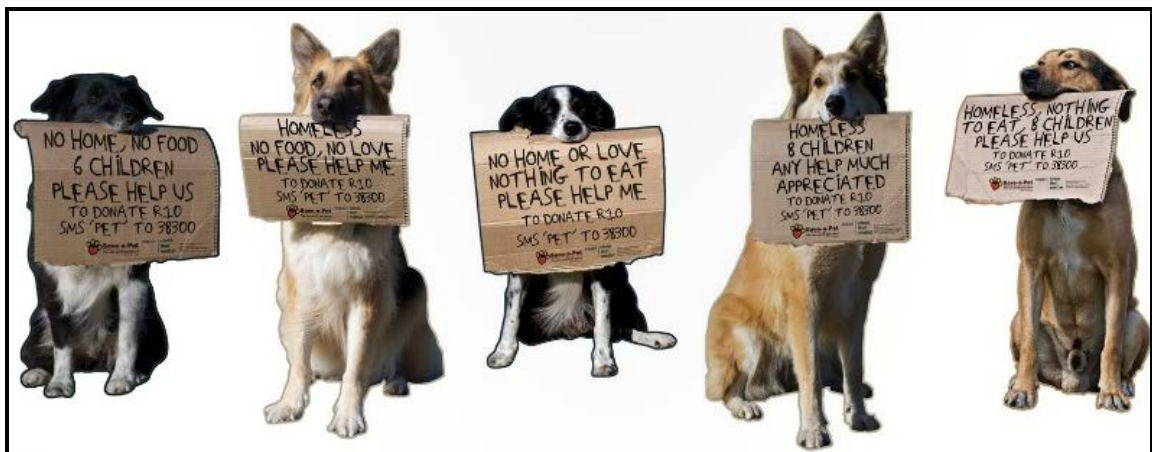
FIGUUR B: Red 'n Troeteldier -ontwerp deur Amor Coetzee en Jedd McNeilage (Suid-Afrika), 2009.

5.2.1 Bespreek die inspirasie vir die Red 'n Troeteldier-veldtog in FIGUUR B. (4)