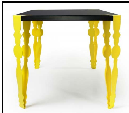
FIGUUR E: Sagte tafel , Kenyon Yeh (Londen), 2011.

Kies TWEE van die tafels hierbo en beantwoord die volgende vrae: