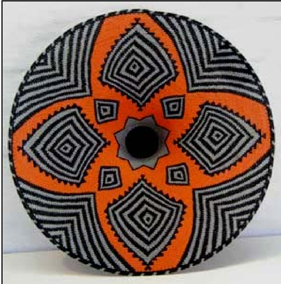
FIGUUR A: Telefoondraadbak deur Zodwa Maphumulo (Suid-Afrika), 2010.

Bespreek die gebruik van die volgende ontwerpelemente en -beginsels in FIGUUR A: