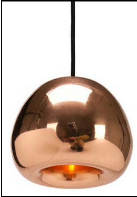
FIGUUR A: Koperskerm -lamp geïnspireer deur Britse erfenis, Tom Dixon (VK), 2005.