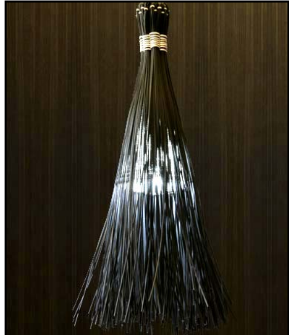
FIGUUR B: You missed a spot (Jy het 'n plekkie gemis) -lamp geïnspireer deur 'n tradisionele besem, Van de Vlam (Suid-Afrika), 2011.