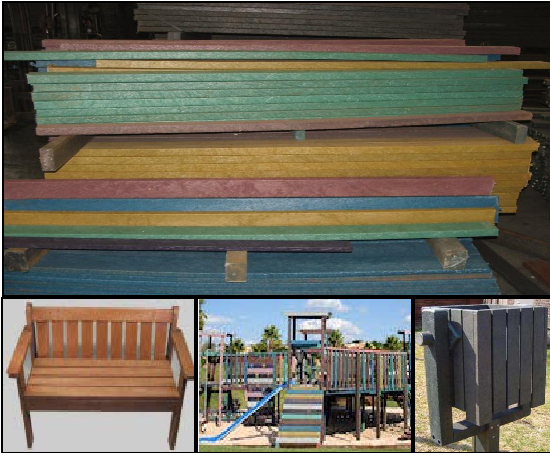
FIGUUR C: Herwinde plastiekplanke (hout) deur Green Plastic Designs (Suid-Afrika), 2009.

6.3.1 Wat is die langtermynomgewingsvoordele van die materiale wat in FIGUUR C gebruik is? (2)