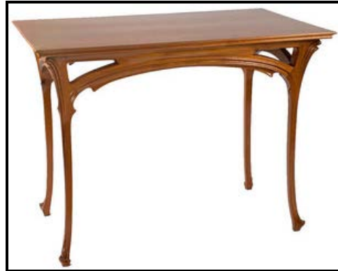
FIGUUR B: Tafel , Henri Sauvage (Frankryk), circa 1900.