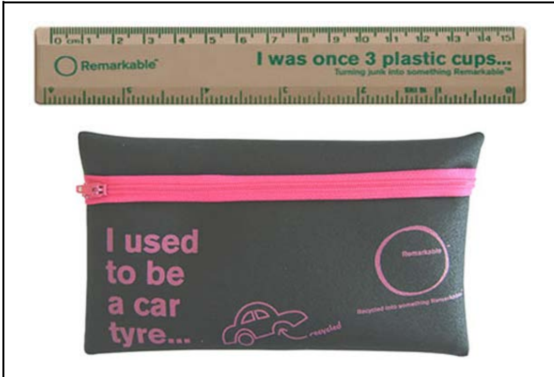
FIGUUR A: Ollymolly -produkte gemaak van herwinde materiale deur Remarkable (Suid-Afrika), 2011.