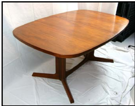
FIGUUR C: Eetkamertafel , Niels Moller (Denemarke), 1950.