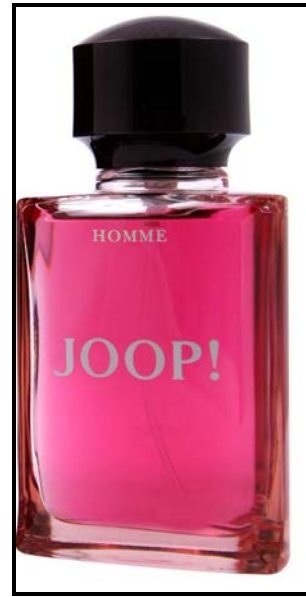
FIGUUR B: JOOP! , fyngeur deur Wolfgang Joop (Duitsland), 1978.

Vergelyk die visuele bronne (FIGUUR A en FIGUUR B) hierbo en bespreek hoe hulle stereotipes kan uitdaag en/of versterk deur na die gebruik van die volgende te verwys: