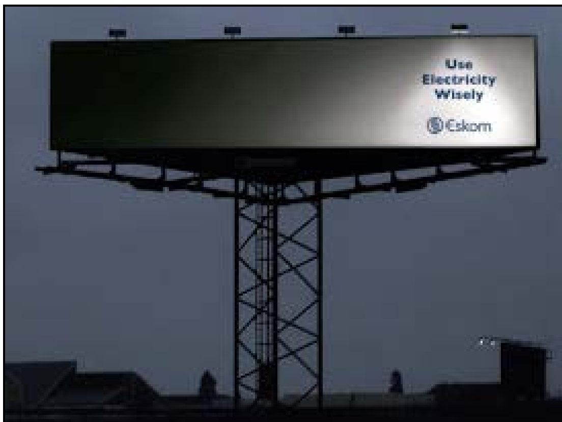
FIGUUR A: Eskom-reklamebord , ontwerper onbekend (Suid-Afrika), 2008.

David Ogilvy van Jupiter Room Agentskap het een keer geskryf: 'Ek het 'n passie vir die landskap, en ek het nog nooit gesien dat 'n reklamebord dit verbeter nie. Reklameborde dra by tot adverteringsrommel en is onooglik en eentonig (vervelig).'