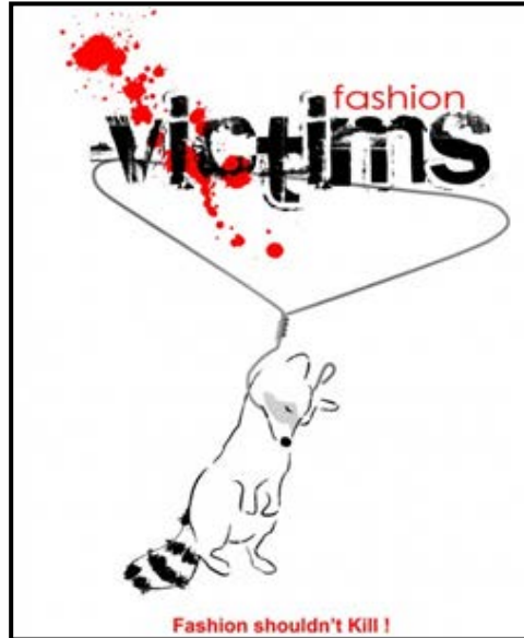
FIGUUR A: Plakkaat deur 'n onbekende ontwerper.

5.1.1 Hoe dra die ontwerper in FIGUUR A hierbo die boodskap van die plakkaat visueel oor? (3)