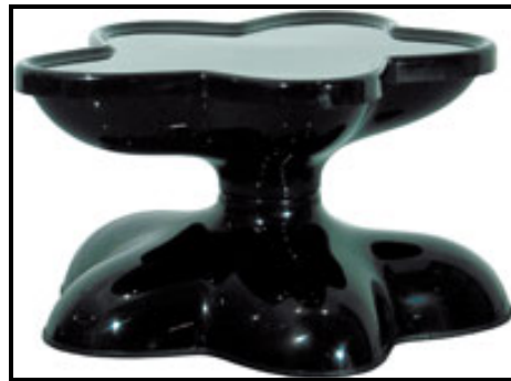
FIGUUR D: Molar Group-koffietafel , Wendell Castle (VSA), 1969.