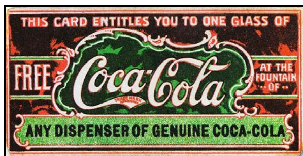
FIGUUR B: Coca-Cola-koepon (VSA), 1896.