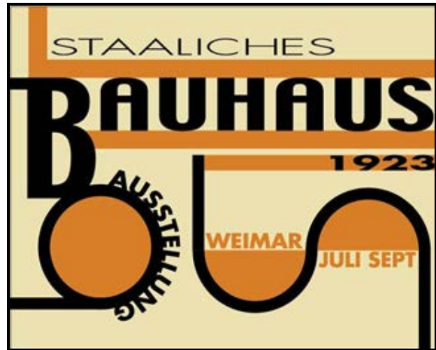
FIGUUR G: Bauhaus-uitstallingsplakkaat , ontwerper onbekend (Duitsland), 1923.

4.2.1 Noem EEN ander ontwerper van ELK van die style/bewegings hierbo. (2)