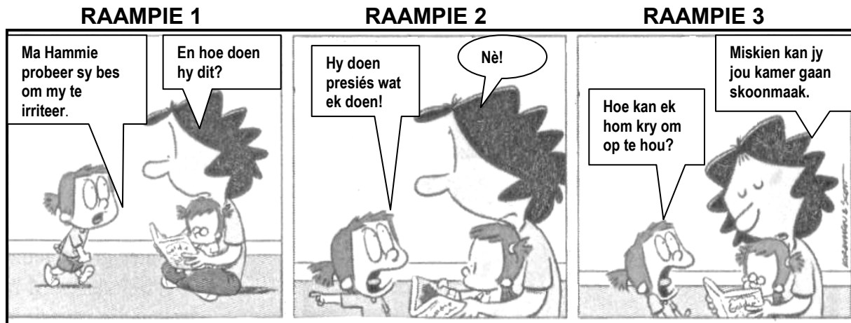
[Verwerk uit Die Burger , 8 Februarie 2018]