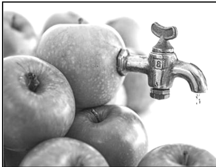
[E amantšwe go tšwa go inthanete]