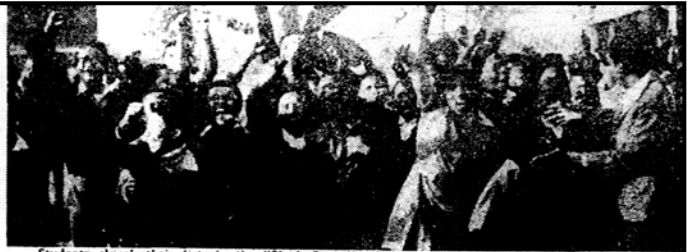
Students clench their fists in the "Black Power" salute as they march through Soweto streets.