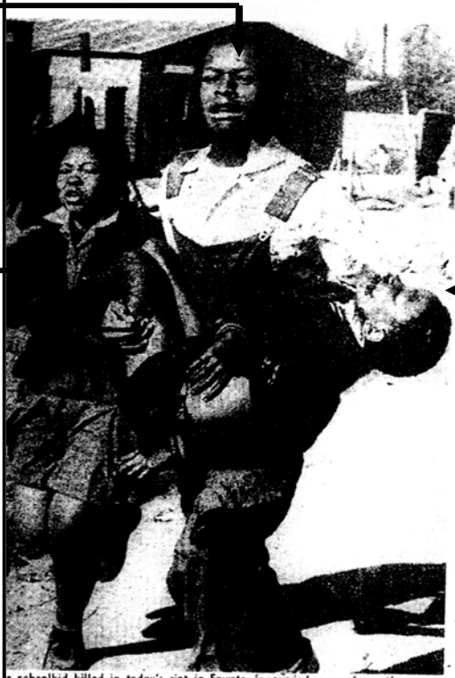
A schoolkid killed in today's riot in Soweto is carried away from the scene of the disturbances. At the time of going to press he had not yet been identified. (More pictures on Page 4).