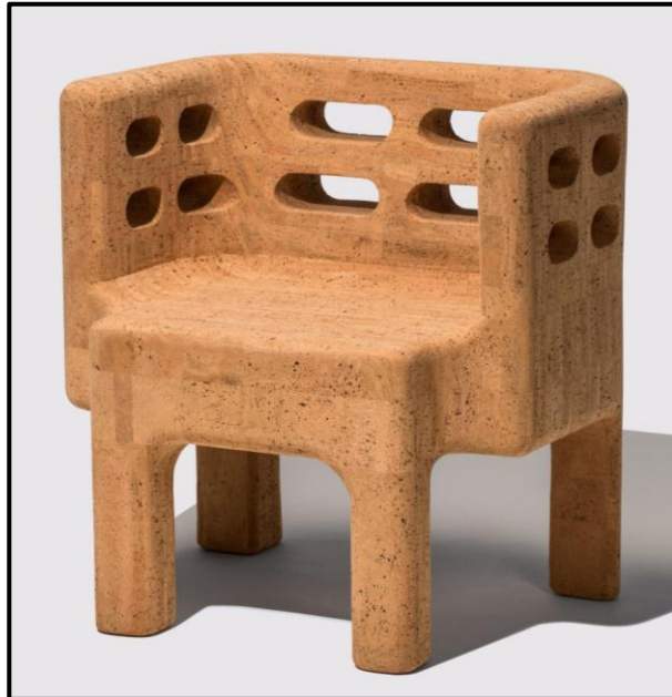
FIGUUR L: Stoel uit die Sobreiro-versameling deur die Campana Brothers (Brasilië), 2018. Die stoel is van kurk gemaak.

(Kurk is 'n materiaal wat uit die bas van die kurkeikeboom verkry word. Die bas word van die boom, wat nooit afgekap word nie, afgestroop om die kurk te oes. Kurk is omgewingsvriendelik, waterbestand en kan dryf.)