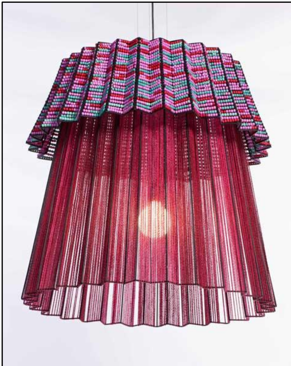
FIGUUR A: Tutu 2.0 Hangende Lig deur Thabisa Mjo (Suid-Afrika), 2017.

1.1.1 Analiseer die gebruik van die volgende elemente en beginsels in FIGUUR A hierbo: