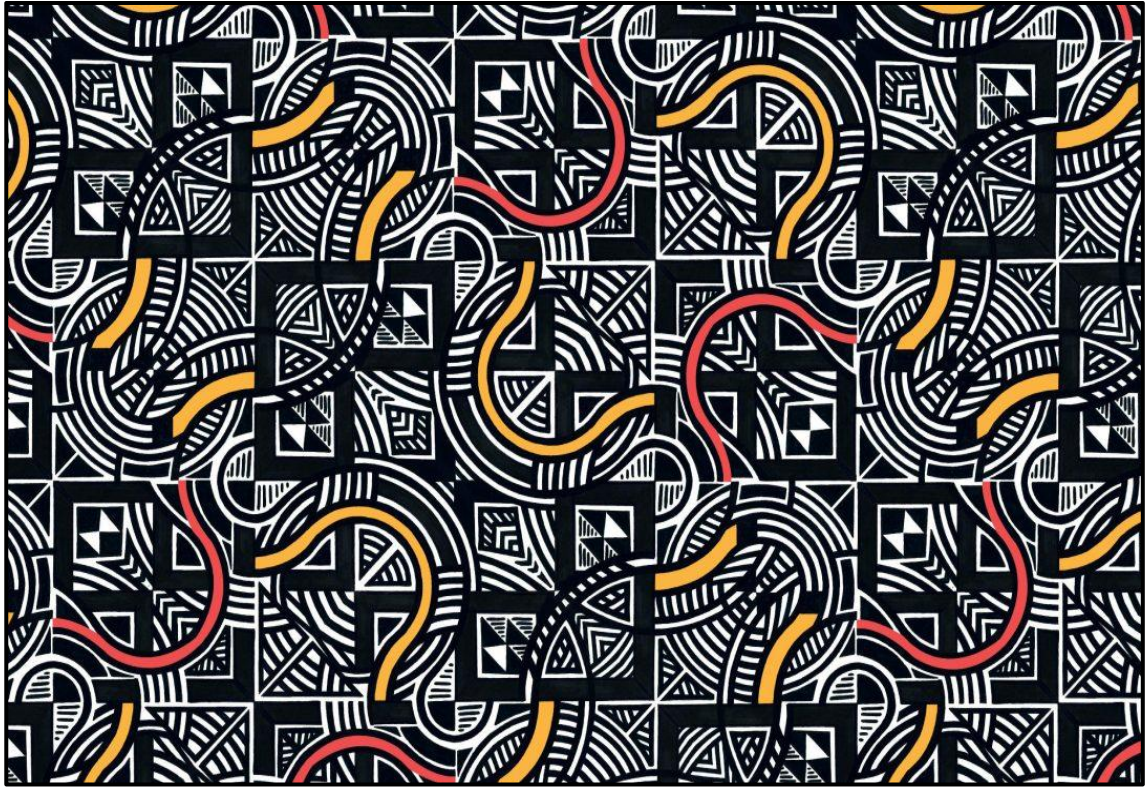
FIGUUR B: Bekroonde Patroonontwerp deur Agrippa Mncedisi Hlophe (Suid-Afrika), 2019.

1.2.1 Analiseer die gebruik van die volgende elemente en beginsels in FIGUUR B hierbo: