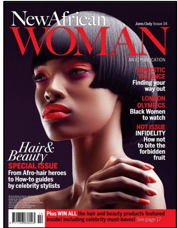
FIGUUR E: New African Women -tydskrifvoorblad deur IC Publications (Londen), 2014.

Vergelyk die tydskrifvoorblad in FIGUUR D met die tydskrifvoorblad in FIGUUR E.