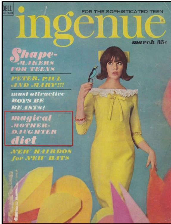
FIGUUR D: Ingenue -tydskrifvoorblad deur Dell Publishing Company (Londen), 1964.