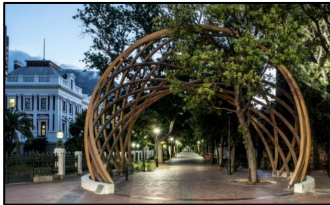
FIGUUR G: #ArchForArch-gedenkboog vir Aartsbiskop Desmond Tutu (Suid-Afrika), 2017.

Skryf 'n opstel (ten minste EEN bladsy) waarin jy die antieke Romeinse Boog in Volubilis, Marokko in FIGUUR F met die kontemporêre #ArchForArch vir Aartsbiskop Tutu in FIGUUR G, vergelyk.