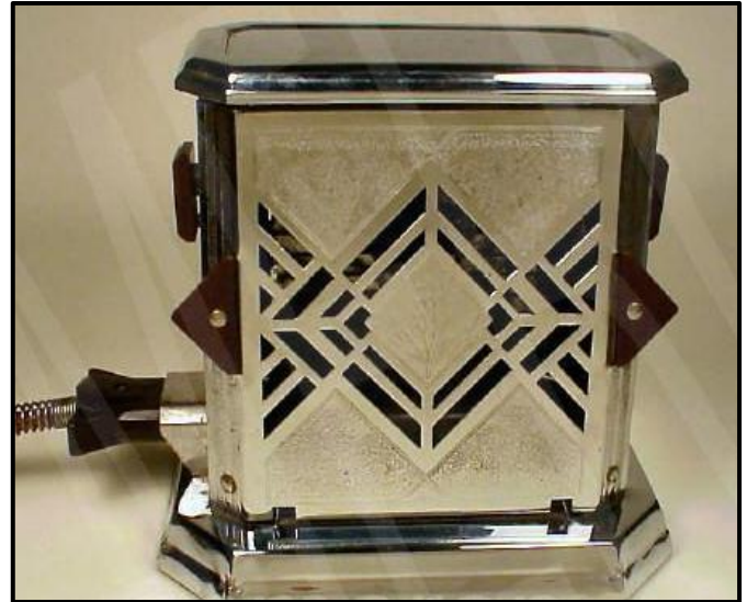
FIGUUR I: Fostoria-broodrooster vervaardig deur Bersted MFG Co (Art Deco) (VSA), 1930's.

Skryf 'n opstel (ten minste EEN bladsy) waarin jy die broodrooster in FIGUUR H met die broodrooster in FIGUUR I hierbo vergelyk. Verduidelik hoe die broodroosters tipies is van die bewegings waartoe hulle behoort.