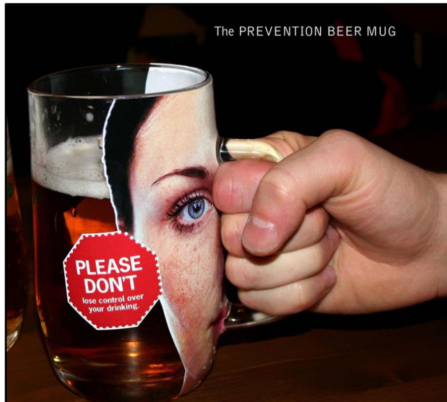
FIGUUR J: Prevention('Voorkoming')-bierbeker-plakkaat deur EURORSCG Advertising Agency (Tseggiiese Republiek), 2008.

5.1.1 Bespreek hoe die boodskap van die plakkaatveldtog in FIGUUR J hierbo oorgedra word deur na die ontwerper se gebruik van uitleg en simbolisme te verwys. (4)