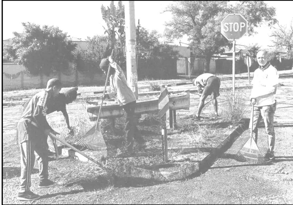
[Sunday Times, 26 Moranang 2020]