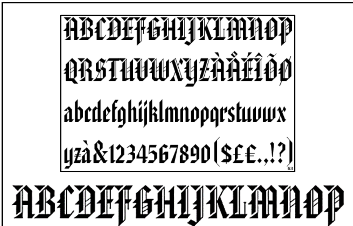
FIGUUR E: Gotiese-manuskrip-lettertipe

Vergelyk die lettertipe in FIGUUR D met die lettertipe in FIGUUR E.