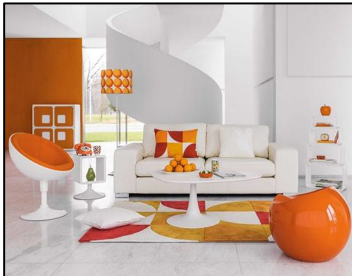
FIGUUR I: Popstyl-interieur , ontwerper onbekend (VSA), datum onbekend.

Skryf 'n opstel (EEN bladsy) waarin jy die TWEE interieurontwerpe hierbo vergelyk en verduidelik hoekom hulle tipies is van die ontwerpbewegings wat hulle verteenwoordig.