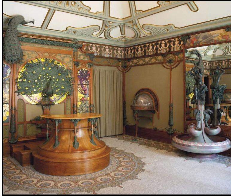
FIGUUR H: Art Nouveau-interieur van Fouguet se juwelierswarewinkel, ontwerp deur Alphonse Mucha (Parys), 1900's.