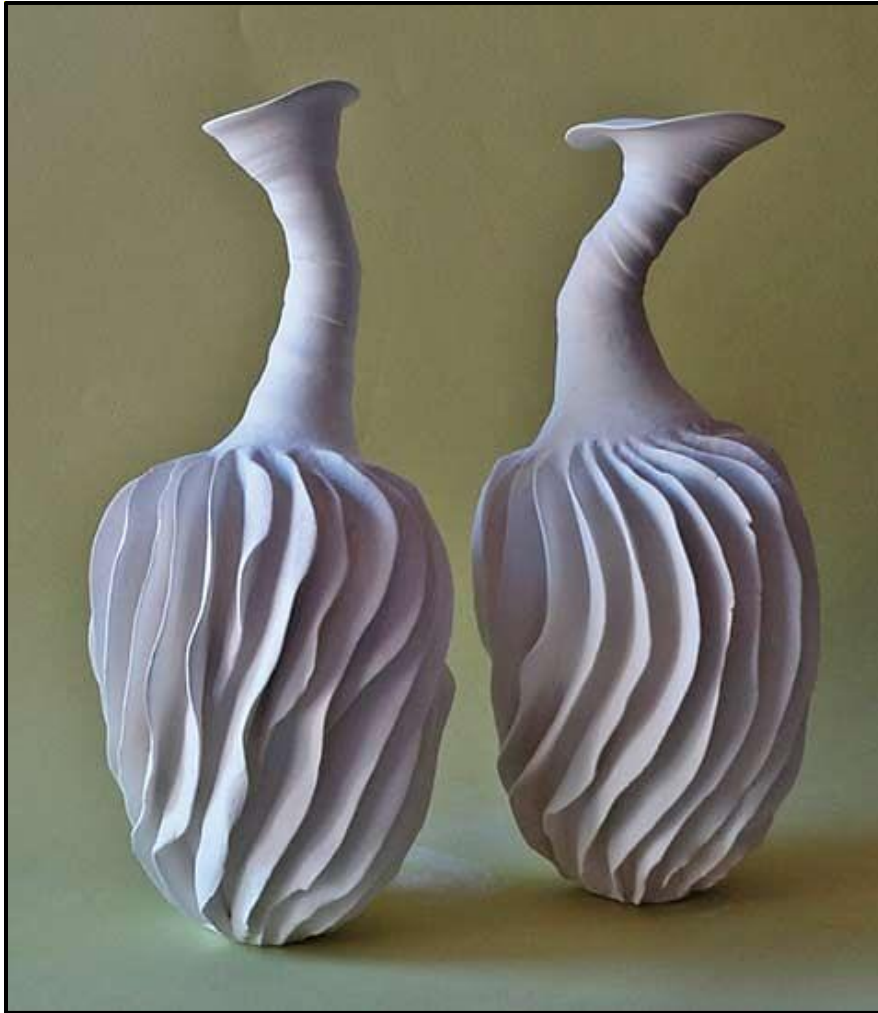
FIGUUR B: Dancing Egrets (Dansende Blouereiers) (watervoël) deur Cecilia Robinson (Suid-Afrika), c. 2012.

Analiseer die gebruik van die volgende terme met betrekking tot FIGUUR B hierbo: