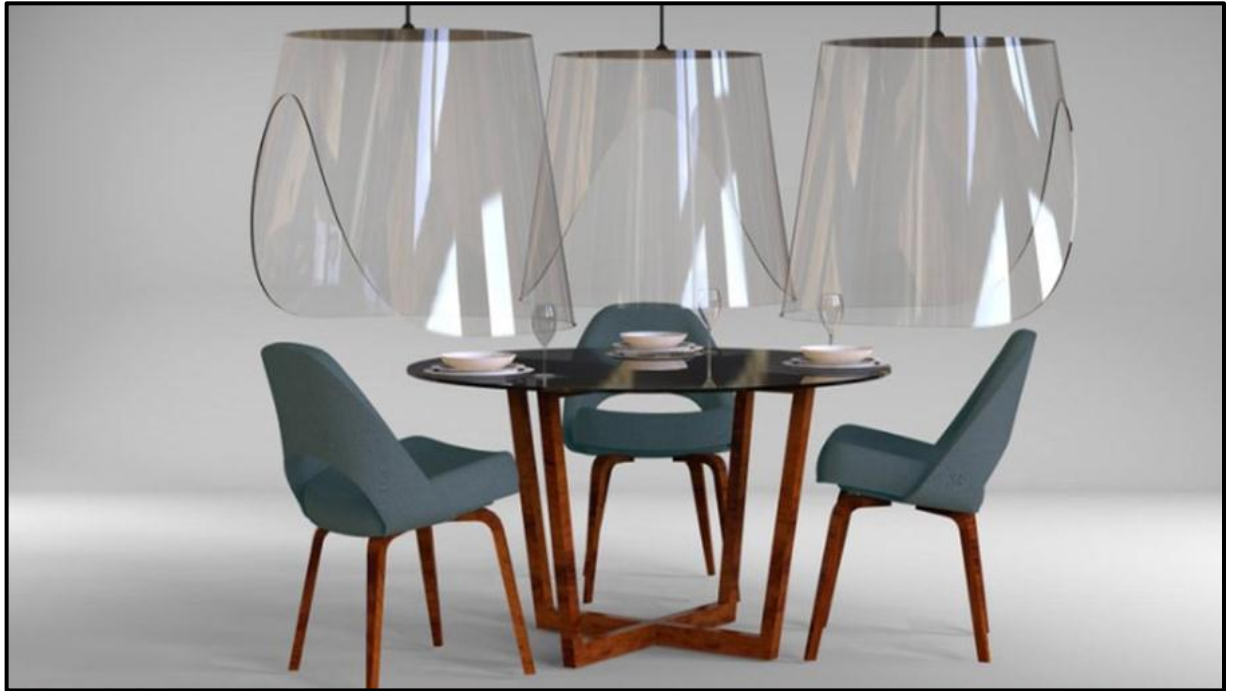
FIGUUR J: Plex'eat Hoods vir post-Covid-19-uiteet in restaurante deur Christopher Gernigon (Frankryk), 2020.