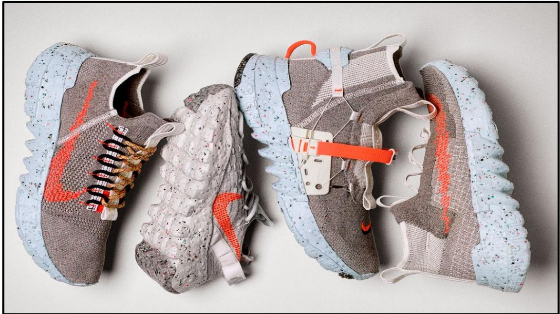
FIGUUR L: Nike Space Hippiie 4 footwear deur Noah Murphy-Reinhertz (VSA), 2020.

Space Hippiie-tekkies word van 85–90% herwinde inhoud gemaak. Hierdie ekovriendelike tekkies word geheel en al van afvalmateriaal van die fabrieksvloer, insluitende plastiekbottels, T-hemde en post-industriële oorskietmateriaal gemaak. 'Move to Zero' is Nike se reis na zero koolstof en zero rommel om die toekoms van sport te help beskerm.