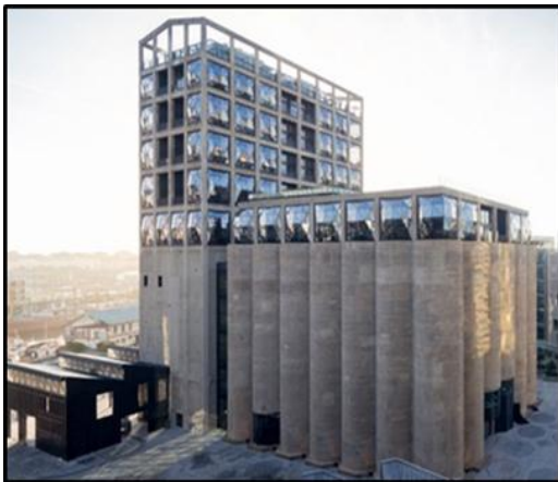
FIGUUR G: Zeitz MOCAA (Museum van Kontemporêre Afrika-kuns), 'n historiese graansilo wat as iets heeltemal anders ingespan is deur Thomas Heatherwick Studios (Kaapstad), 2017.