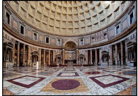
Detail van die interieur van die Romeinse Pantheon . Die koepelplafon bestaan uit gekassetteerde ('coffered') betonpatrone.