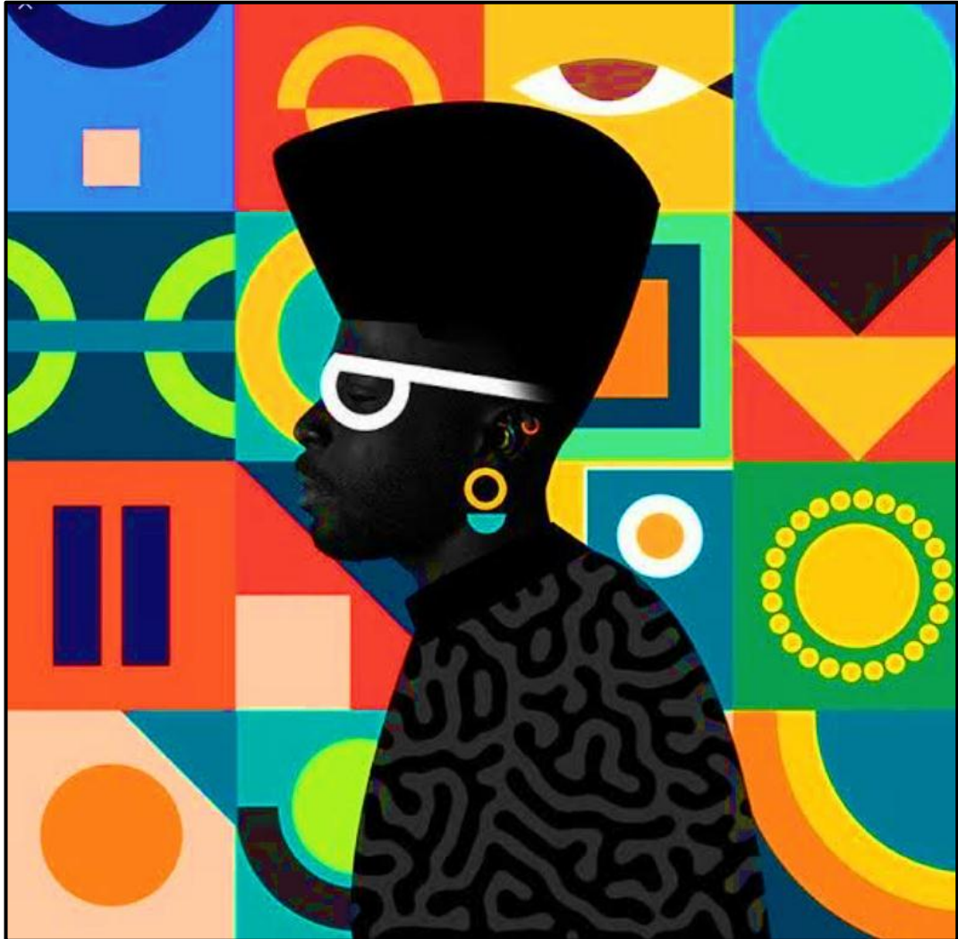
FIGUUR A: Portrette en Kleur -muurpapierontwerp deur Temi Coker (VSA), 2019.

Bespreek die muurpapierontwerp in FIGUUR A hierbo deur na die volgende elemente en beginsels te verwys: