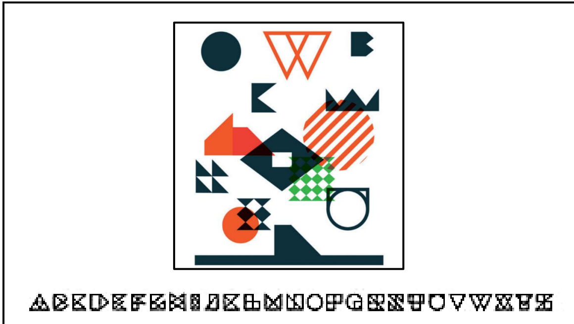
FIGUUR D: BaBa-lettertipe deur Garth Walker (Suid-Afrika), 2002.