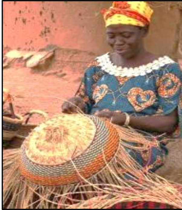
FIGUUR K: Zoeloe-mandjie-weefwerk , Hlabisa, KZN, datum onbekend.

5.2.1 Bespreek die waarde daarvan om tradisionele kunsvlyte in die hedendaagse samelewing te beoefen/toe te pas. Verwys na FIGUUR K om jou antwoord te ondersteun. (2)