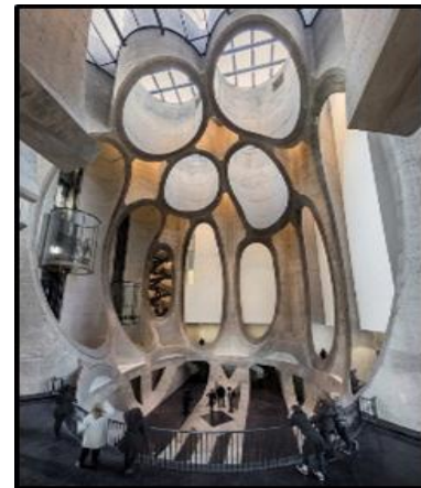
Atrium van die Zeitz MOCAA . Die oorspronklike binnestruktuur van 56 styfgepakte, silindervormige betongraansilo's is uitgekerf om die atrium te skep.

Skryf 'n opstel (ten minste EEN bladsy) waarin jy die binnenshuise en eksterne struktuur van die kontemporêre Suid-Afrikaanse Zeitz MOCAA-gebou in FIGUUR G met die binnenshuise en eksterne struktuur van die Klassieke gebou, die Pantheon, in FIGUUR F, vergelyk.