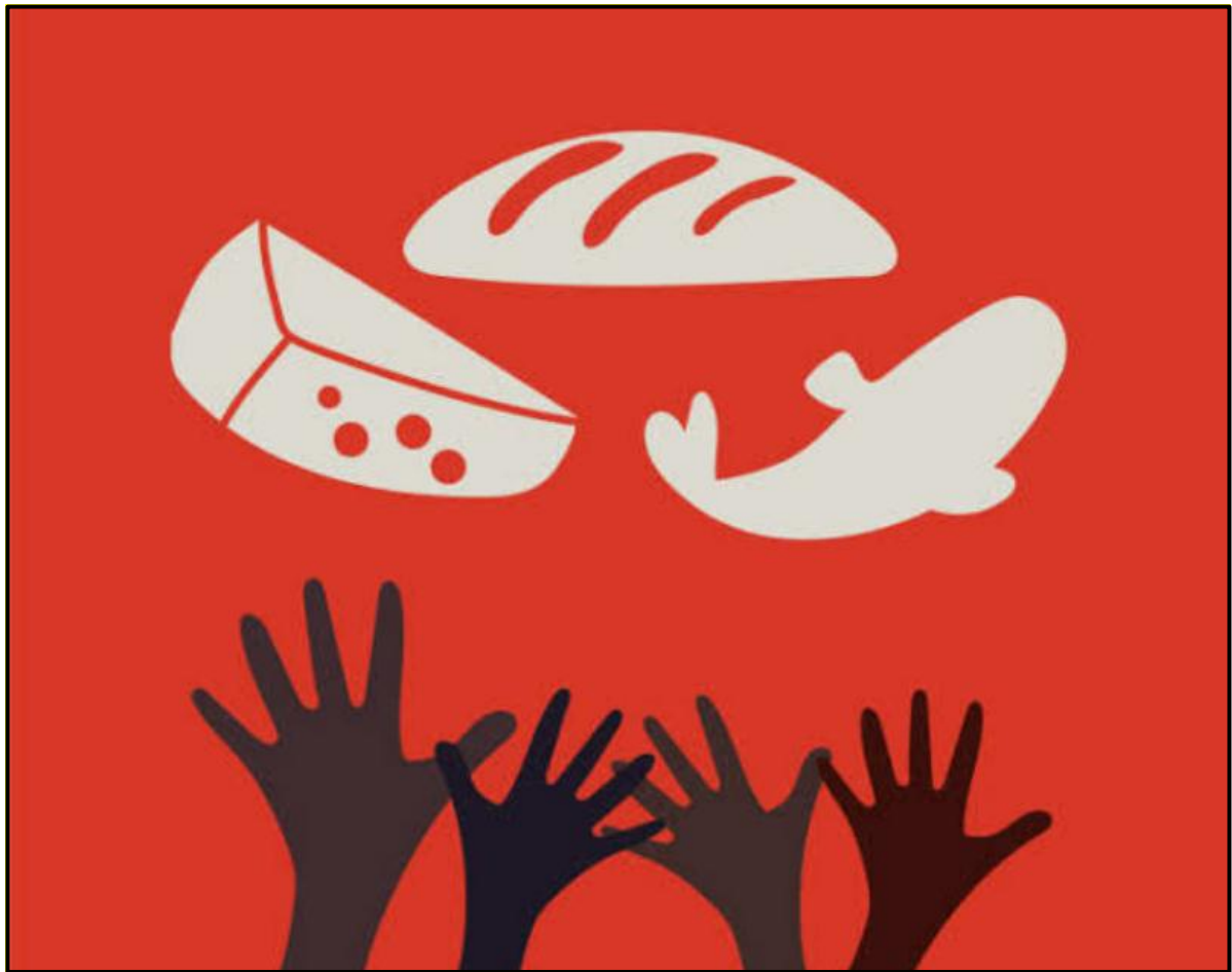
FIGUUR C: Plakkaat vir Voeding en Hongerte , Wêreldgesondheidsorganisasie, ontwerper onbekend, 2020.