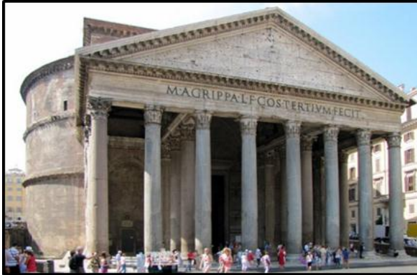
FIGUUR F: Die Romeinse Pantheon , in opdrag van Keiser Hadrian (Rome, Italië), 113–125 AE.