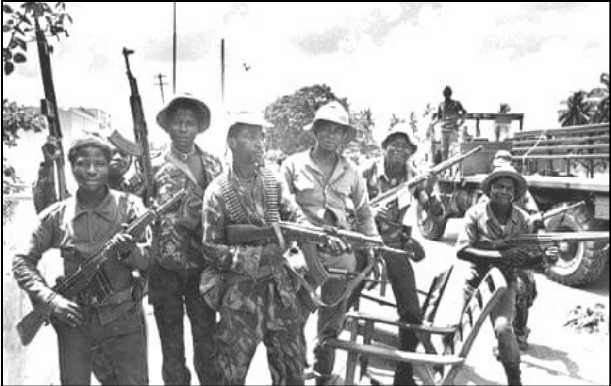
[Uit die Guardian -koerant, 5 Mei 2014]

Die foto hieronder met die titel 'Angola's Brutal History and the MPLA's Role in it', het in die Guardian -koerant van 5 Mei 2014 verskyn. Dit is in Desember 1975 geneem en beeld soldate van die 'Popular Movement for the Liberation of Angola' (MPLA) uit wat in die Angolese Burgeroorlog geveg het.