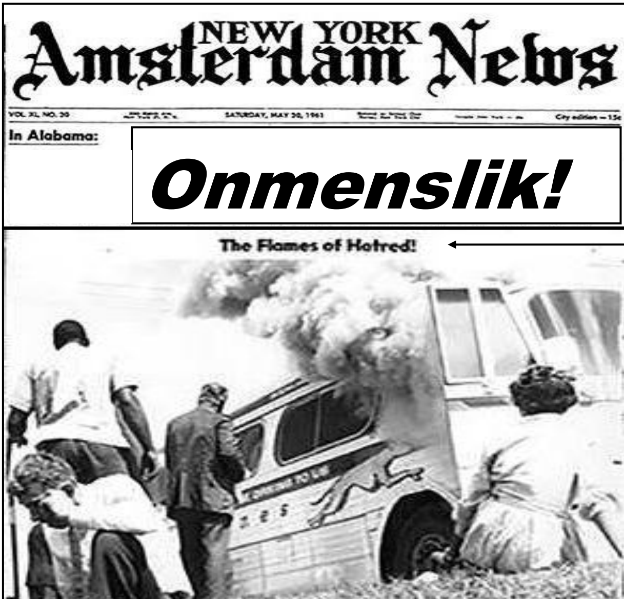
[Uit NEW YORK Amsterdam News , 20 Mei 1961]

Die koerantberig hieronder is op 20 Mei 1961 in die NEW YORK Amsterdam News gepubliseer. Dit het 'n foto gebruik om doeltreffend verslag te doen oor die uitdagings wat Vryheidsryers met hulle betoging teen rassese segregasie in die Verenigde State van Amerika teëgekrom het.