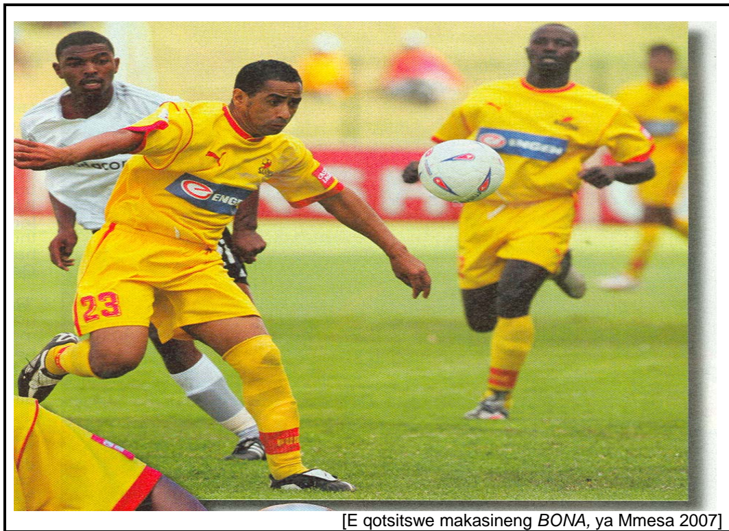
[E qotsitse makasineng BONA , ya Mmesa 2007]

Maafrikaborwa a thabile haholo ka ho tlišwa ha tlhodisano ya mohope wa lefatshe wa papadi ya bolo ya maoto wa 2010. Ona ke monyetlahadi wa bohlokwa wa ho matlafatsa Maafrikaborwa moruong. Mmuso o sebetsa ka thata ho etsa hore baahi ba naha ena ba tle ba tshwaele ketsahalong ena. Empa jwale, tšietsi e kgolo ke ho re tlhahisoleseding e mabapi le ditokisetso e monyebe, mme setjhaba ha se tsebe seo se lokelang ho se etsa hore se tle se une molemo ketsahalong ena. Ha o bona, ke eng seo setjhaba se lokelang ho se etsa? Ngola moqoqo oo ho wona o hlalolang mehopolo ya hao mabapi le ntlha ena. Sehlooho sa moqoqo e be, Nna ke bona tharollo ya taba ena e le