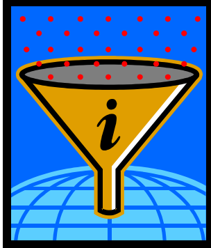
Iyani Business Enterprise