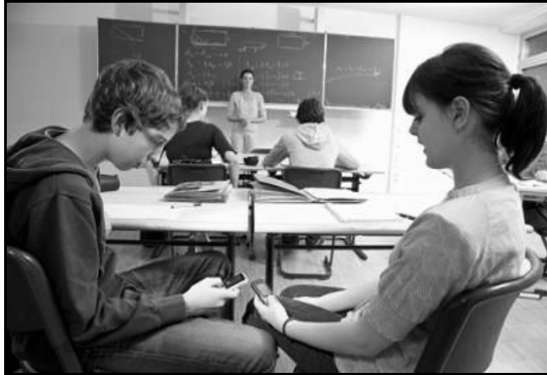
[Zwi khou bva kha Magazine ]