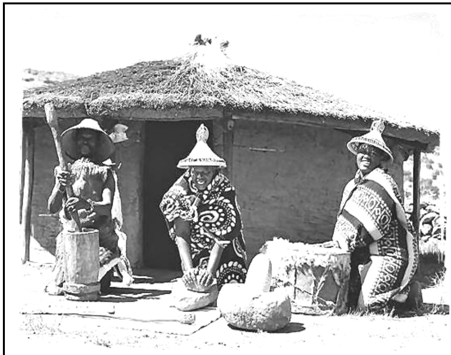
[Setshwantsho se qotsitswe bukeng ya Ukhanya , 2012: 129]