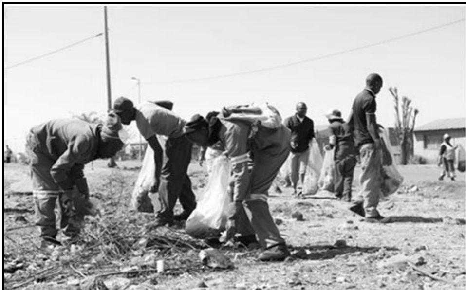
[Se nopotswe go tswa mo inthaneteng]

Baagi ba motse wa lona ba simolotse letsema la go phepafatsa tikologo le go rotloetsa baagi go e tshola e le phepa. Lo ne lo tsenetse kopano e e mabapi le letsema leo. Kwala lenaneotema le metsotso ya kopano eo.