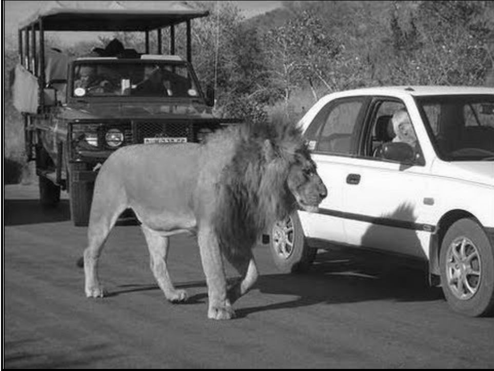
[Tshi bva kha: inthanete]