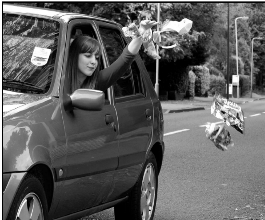
[Tshi bva kha Inthanethe]