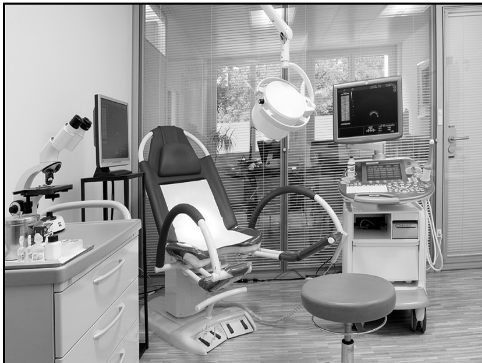
[Tshi bva kha: Inthanethe]