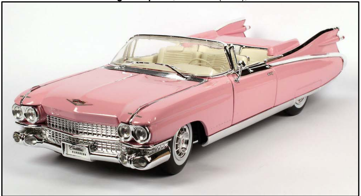
FIGUUR I: Cadillac Eldorado , Pop Design (VSA), 1959.

Skryf 'n vergelykende opstel (ten minste EEN bladsy) waarin jy bespreek hoe FIGUUR H en FIGUUR I kenmerkend is van die ontwerpbewegings wat hulle verteenwoordig.