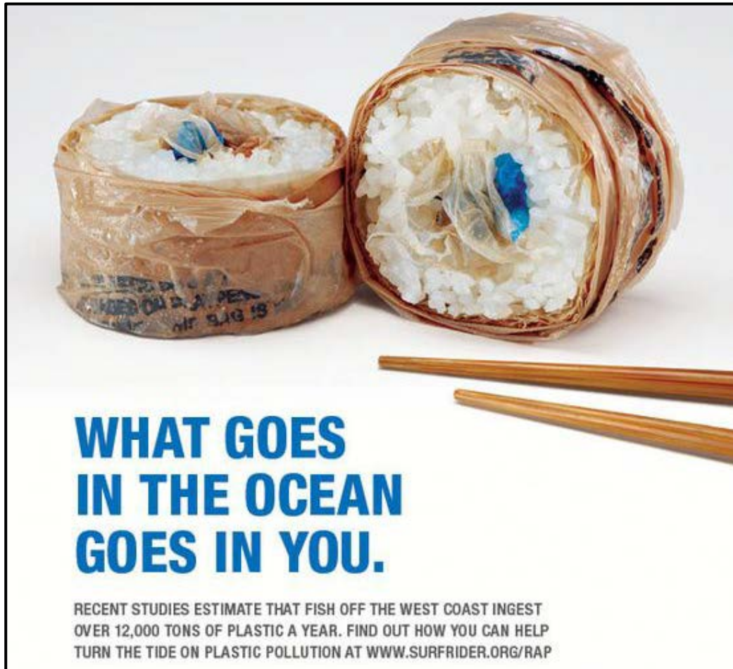
FIGUUR K: Plastiekbesoedeling-veldtog deur Surfrider (Europa), 2012. Die 'kos' hierbo stel sushi-rolletjies, Japanese seekos, voor.

6.1.1 Bespreek hoe die plakkaat in FIGUUR K die aandag op die omgewingswaarskuwing hierbo vestig. (4)