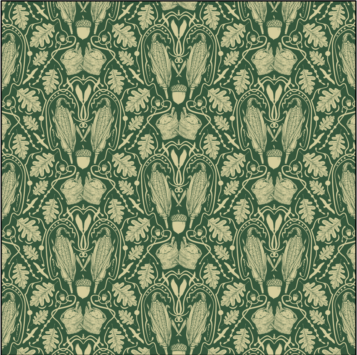
FIGUUR B: Heraldiese Mieliepatroon-muurpapierontwerp deur Quagga (Suid-Afrika), 2012.

Analiseer die gebruik van die volgende in FIGUUR B hierbo: