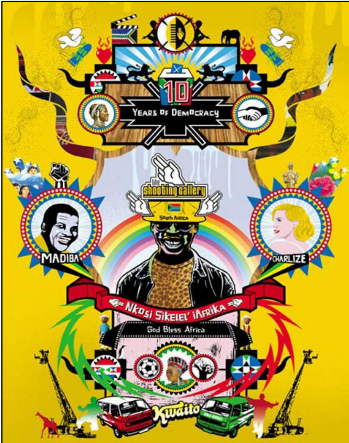
FIGUUR C: Makarapa deur Plan International (Suid-Afrika), 2015.