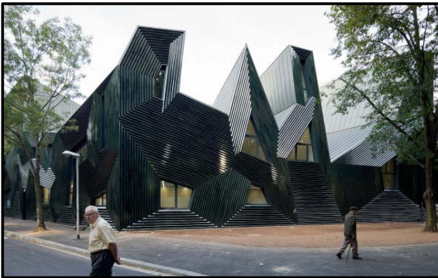
FIGUUR G: Mainz-sinagoge deur Manuel Hertz Architects (Duitsland), 2010.