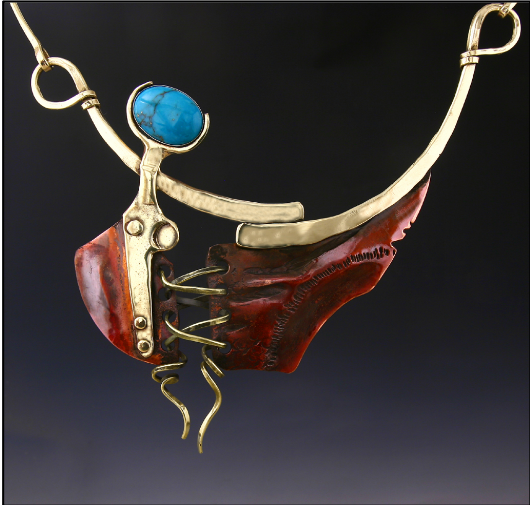
FIGUUR A: Brons-koper-en-turkooishangertjie deur Mike Edelman (Maryland, VSA), 2016.

Bespreek FIGUUR A met verwysing na die volgende: