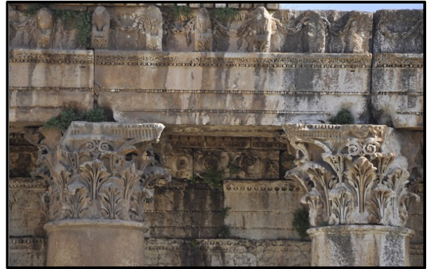
Detail van Bacchus-tempel , argitek onbekend (Baalbek, Libanon), 3 de eeu VHJ.