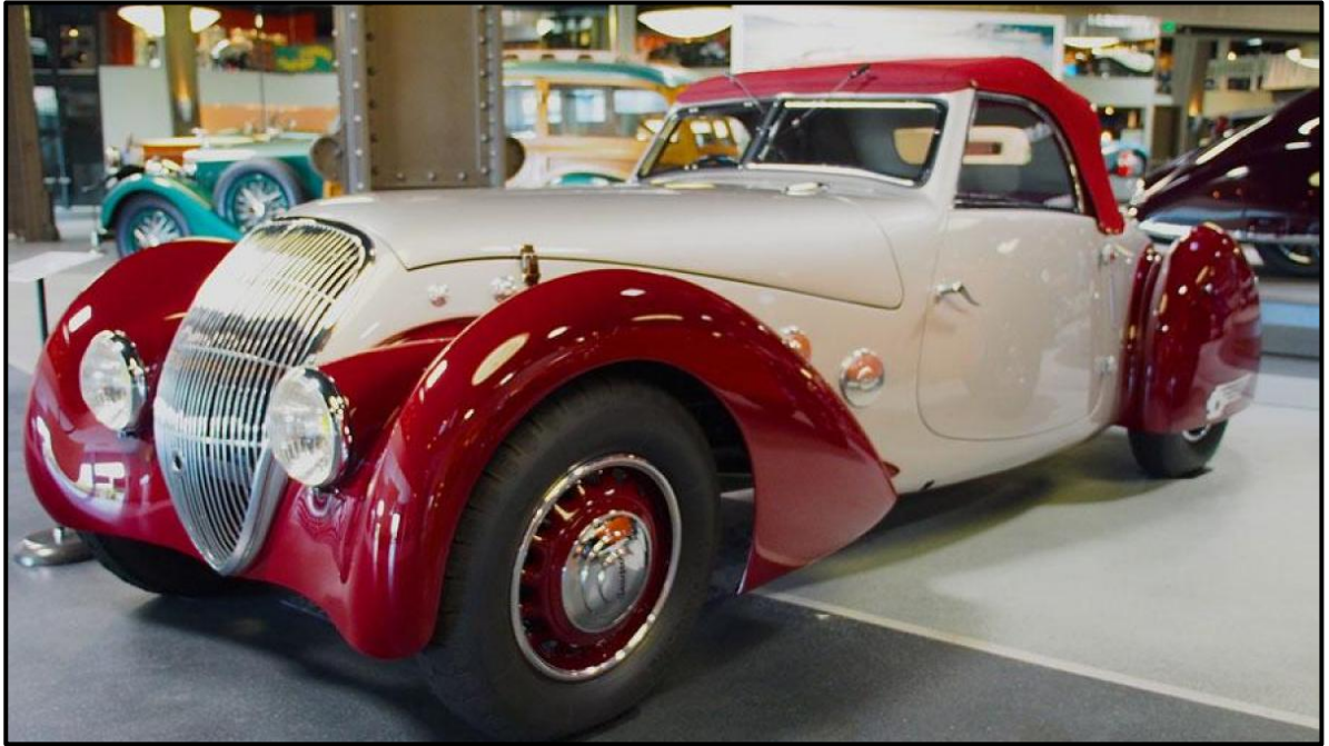
FIGUUR H: Bugatti Tipe 57 , Art Deco (Italië), 1934 tot 1940.