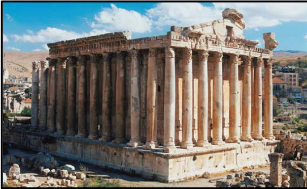
FIGUUR F: Bacchus-tempel , argitek onbekend (Baalbek, Libanon), 3 de eeu VHJ.