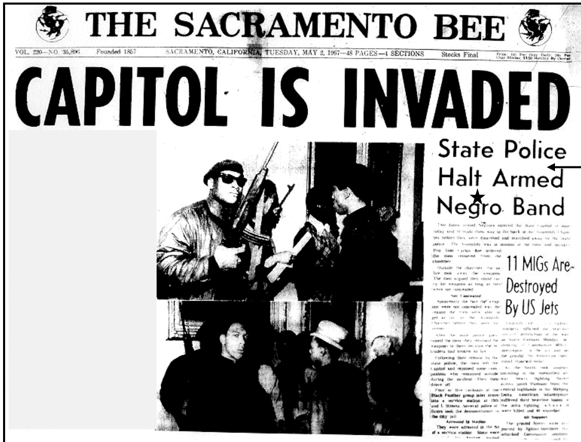
[Uit http://legallacuna.wordpress.com/2012/06/07/prospecting-in-the-martial-imaginary/ . Toegang op 20 September 2017 verkry.]

Hierdie bron is geneem uit 'n Kaliforniese koerant, The Sacramento Bee , wat op 2 Mei 1967 verskyn het. Die hoofopskrif lui: 'CAPITOL IS INVADED' ('KONGRES-GEBOU INGENEEM') en die onderopskrif lui: 'State Police Halt Armed Negro★ Band' (Staatspolisie Keer Gewapende Neger★-bende).