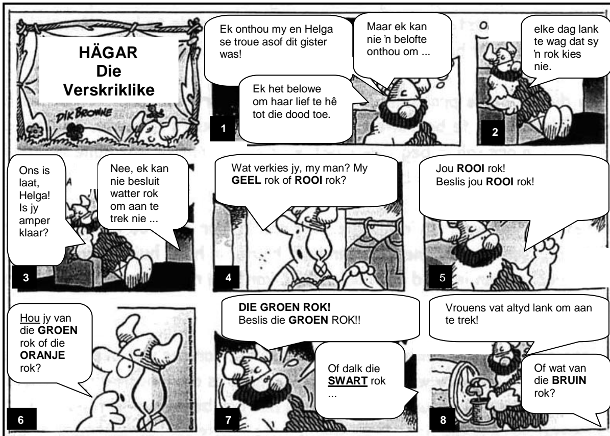
[Uit: Beeld , Maart 2010]

Die taalvrae wat volg, is op die strokiesprent hieronder gebaseer.