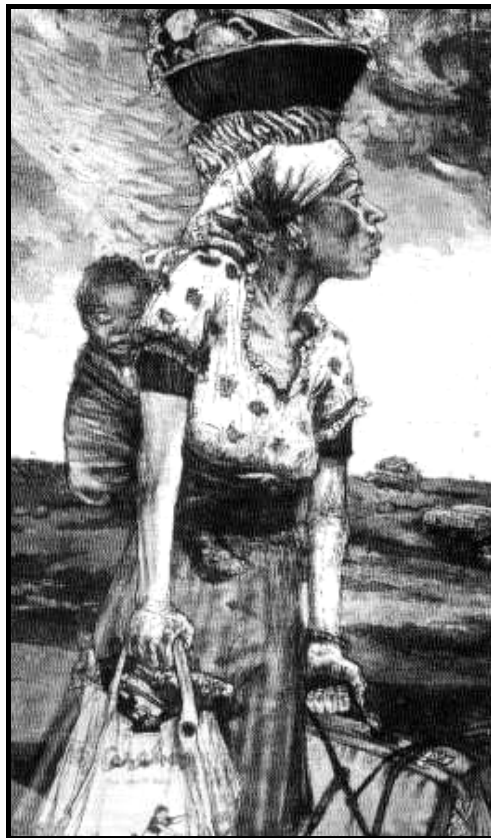
[Uit: Aardklop Feesgids , 2008]