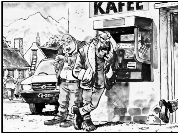
[Uit: Weg , September 2008]