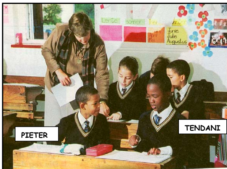
[Verwerk uit: RAPPORT-TYDSKRIF , 21 November 2007]