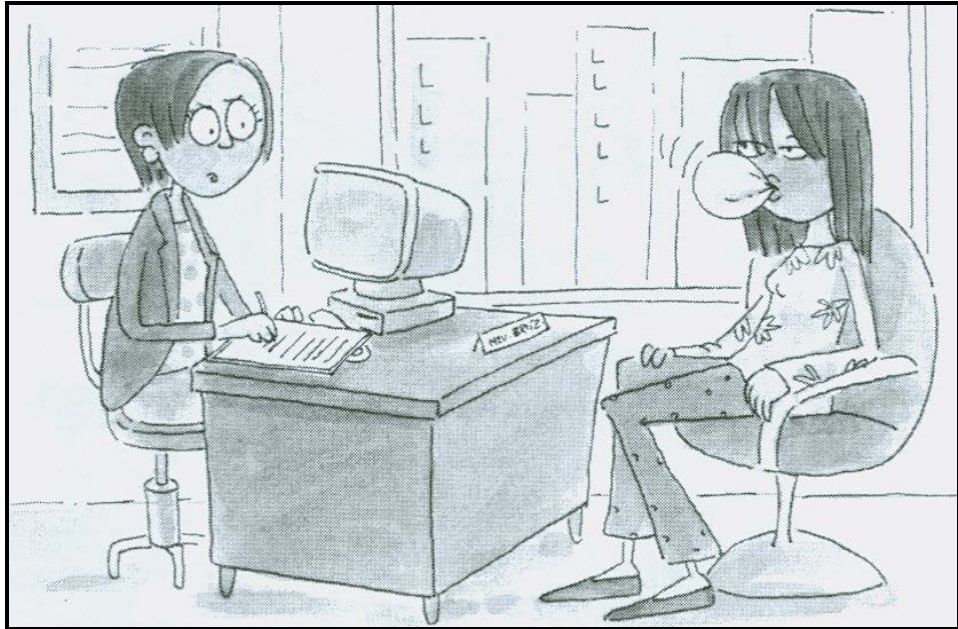
[Uit: Shuters Life Orientation, Gr. 9 ]