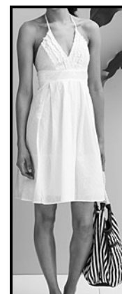
Een rok met dun bandjies