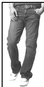
Twee paar tekkies