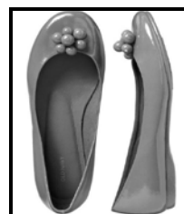
Twee paar skoene