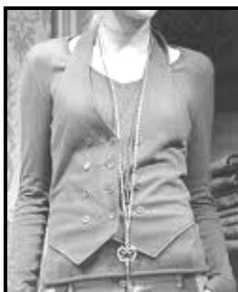
Een linne- onderbaadjie