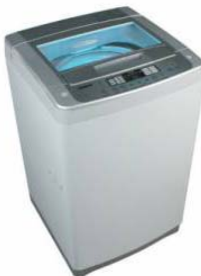
FIGUUR 2: Siemens bolaiwasmasjien