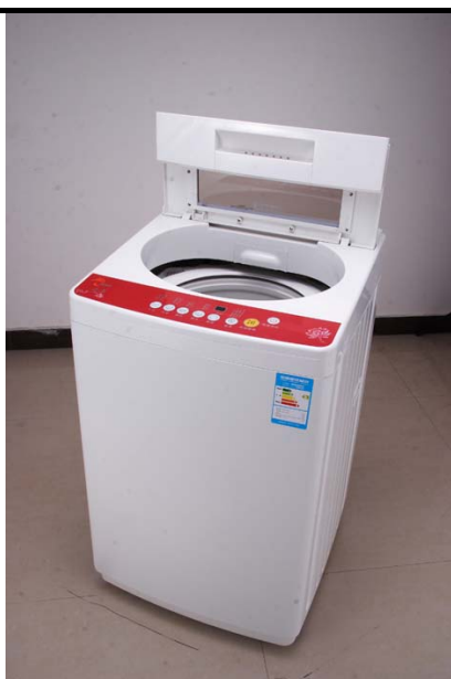
FIGUUR 1: Sharp bolaiwasmasjien