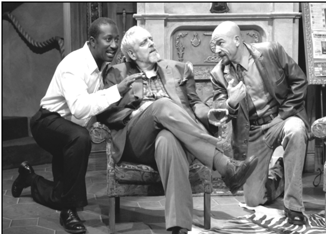
Die karakters Thami, Smith en Johan in Groundswell