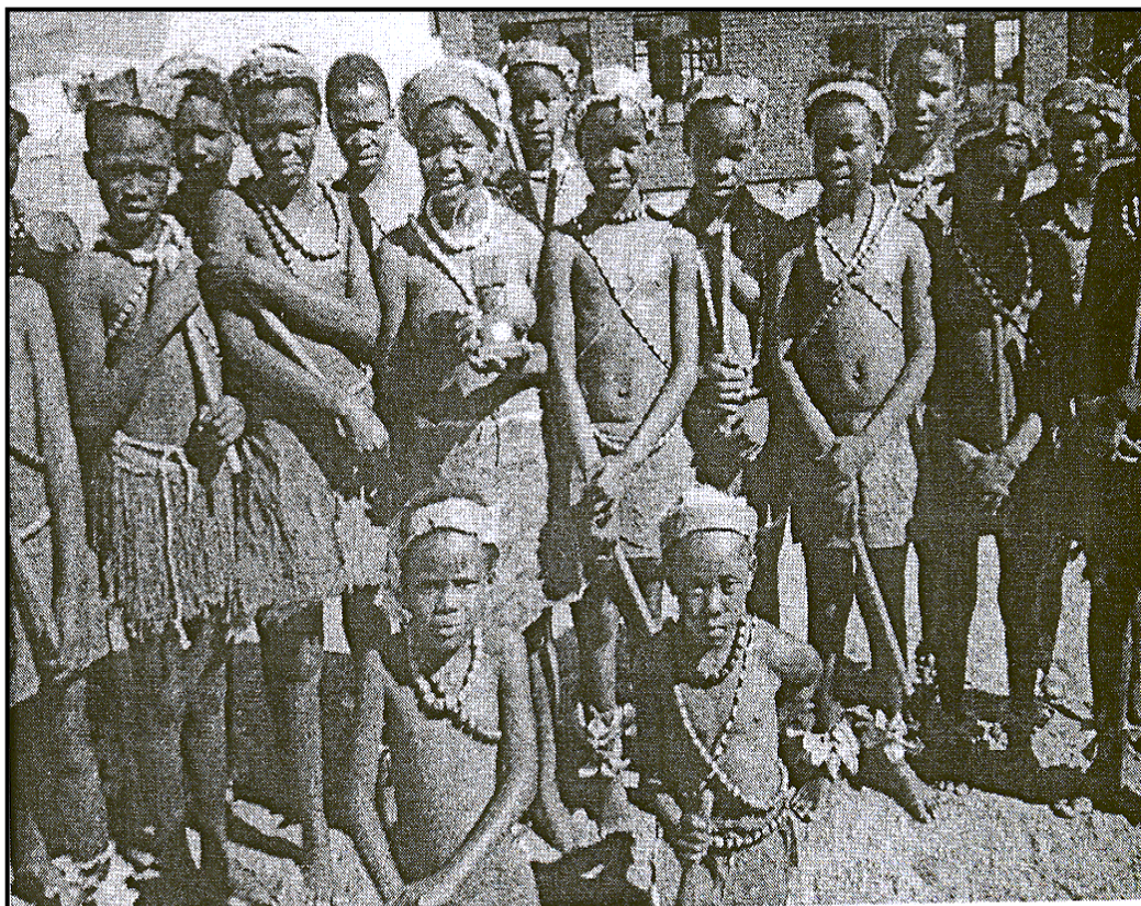
[A re šomeng, Puku ya moithuti 2006: 83]

1.6 Mmino le moaparo wa setšo, e sa le segagešo. Efa dikgopolo tša gago o lebeletše seswantšho sa ka tlase. [50]