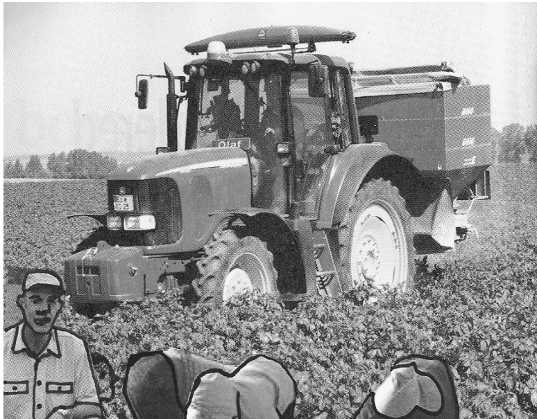
[Se nolofaditšwe go tšwa go Farmer's weekly , 03/2010]

(e) Re na le mengwaga e seswai re phela ka tsela ye.