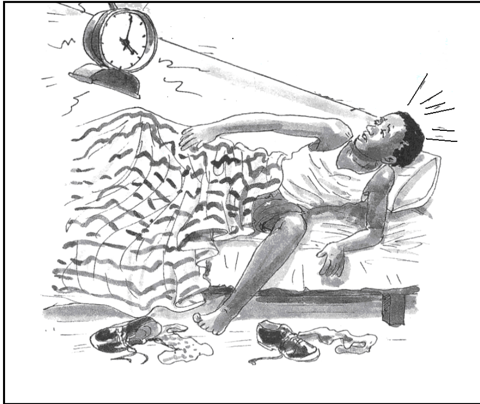
[Uit: Oxford Life Orientation, 2006]