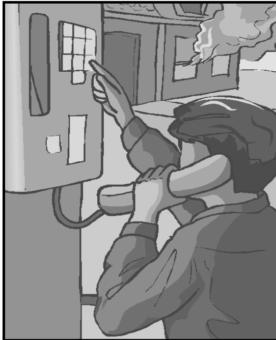
[Uit: Art Explosion]